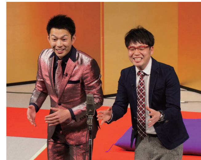
↓ 漫才コンビ「母心」による漫才

12月21日から22日にかけて、サイエンスクリスマスキャンプがきいばすで開催されました。このイベントは、小学校5、6年生と中学生を対象に、科学を探究する楽しさを感じてもらおうと町が開催したものです。参加した児童・生徒らは、講師から助言を受けながら情報や化学、エネルギー等の各分野の実験・研究を行い、科学の楽しさを体験していました。