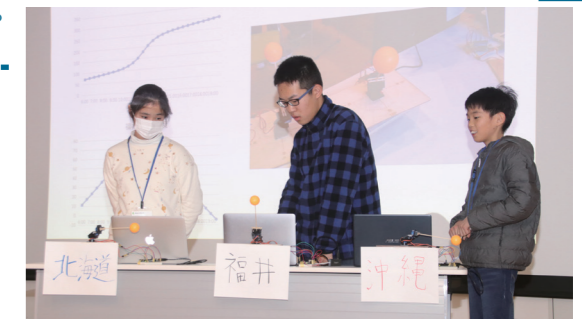
↑ 太陽の動きをプログラミングして動かす子どもたち