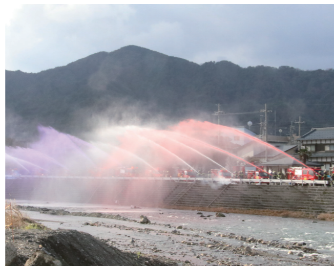
↓ 耳川に向けて一斉放水を行う美浜消防団員

1月1日に、レインボーラインで初日の出を見るイベントが開催されました。当日は、雲がかかり山頂公園から初日の出を見ることはできませんでしたが、参加者からは足湯に入ったり、景色を撮影したりして新年の朝を迎えていました。会場では、御神酒が振る舞われたほか、焼き団子やホットコーヒー等も販売され、多くの人で賑わっていました。