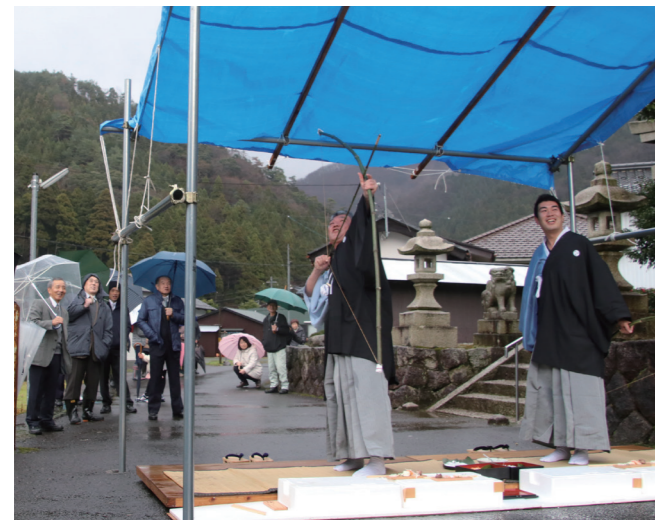
↓ 「ヤリマシトー」と叫びながら矢を放つ弓打ち役

1月6日に、カイト講が新庄で行われました。この行事は、無病息災や家内安全を祈り、区内の子どもたちが昔から伝わる祝歌を歌いながら区内の家々を回るものです。子どもたちは「今年の年は、めでたい年で…」から始まる祝歌を声を合わせて歌い、家の人からお礼のお菓子やお年玉を受け取っていました。