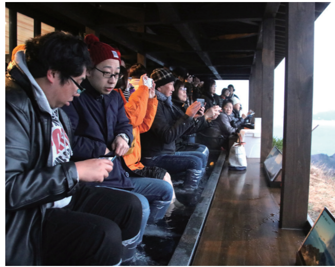
↓ 足湯に入りながら日の出を待つ参加者

1月13日に、弓打講が八幡神社（新庄）で行われました。この神事は、放った矢が的から外れることで、その年の豊作と厄払いになると伝えられているものです。当日は、袴姿の弓打ち役2人が「ヤリマシトー」と叫びながら的を外して矢を放ち、的から外れた矢を矢拾い役が的に突き刺して神事を締めくくりました。