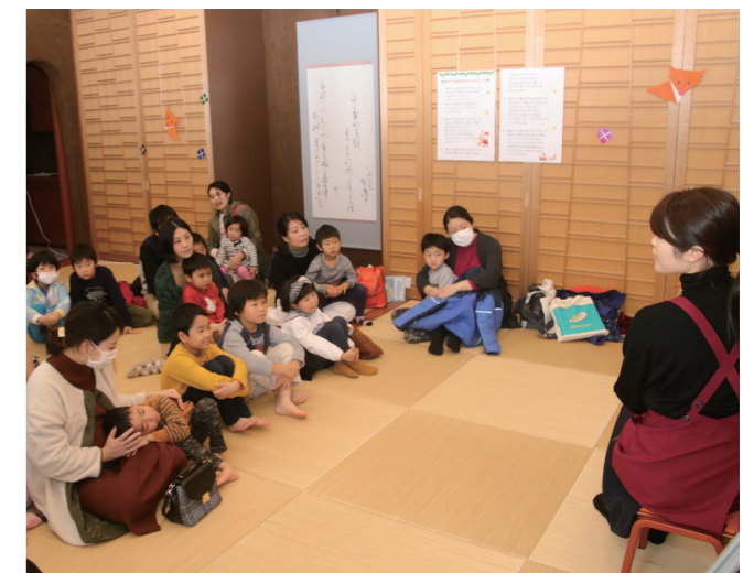
↓ 絵本の読み聞かせを楽しむ子どもたち

12月21日に、NHKのラジオ番組「真打ち競演」の公開録音がなびあすで行われました。当日は、6組のベテラン芸人が落語や漫才等を披露し、訪れた観客約400人を大いに楽しませていました。録音された番組は、第1部が3月7日の午前10時5分、第2部が3月14日の午前10時5分から、NHKラジオ第1放送にて放送される予定です。