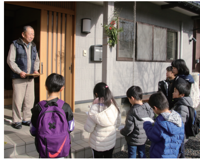
↓ 玄関先で祝歌を歌う子どもたち