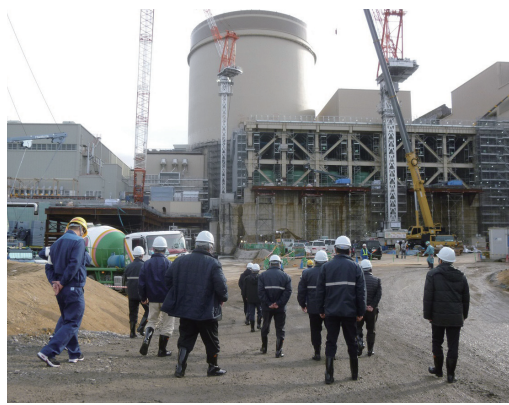
↑3号機周辺の安全対策工事を視察

町内の団体やグループ等で、1・2号機の廃止措置の状況や、3号機の安全性対策について、現地見学を希望される場合は、お気軽にお問い合わせください。