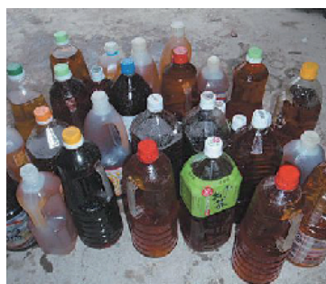
↑回収された食用廃油