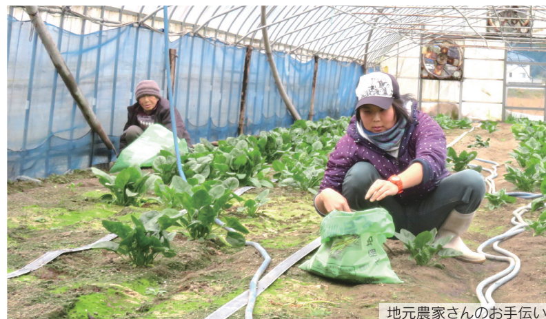
地元農家さんのお手伝い