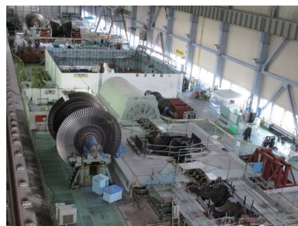
↑1・2号機の廃止措置工事の様子

また、3号機では、福島第一原子力発電所事故を踏まえて定められた新規制基準に適合するため、平成29年6月から発電所の安全性を高める工事が実施されており、令和2年7月の工事完了が予定されています。