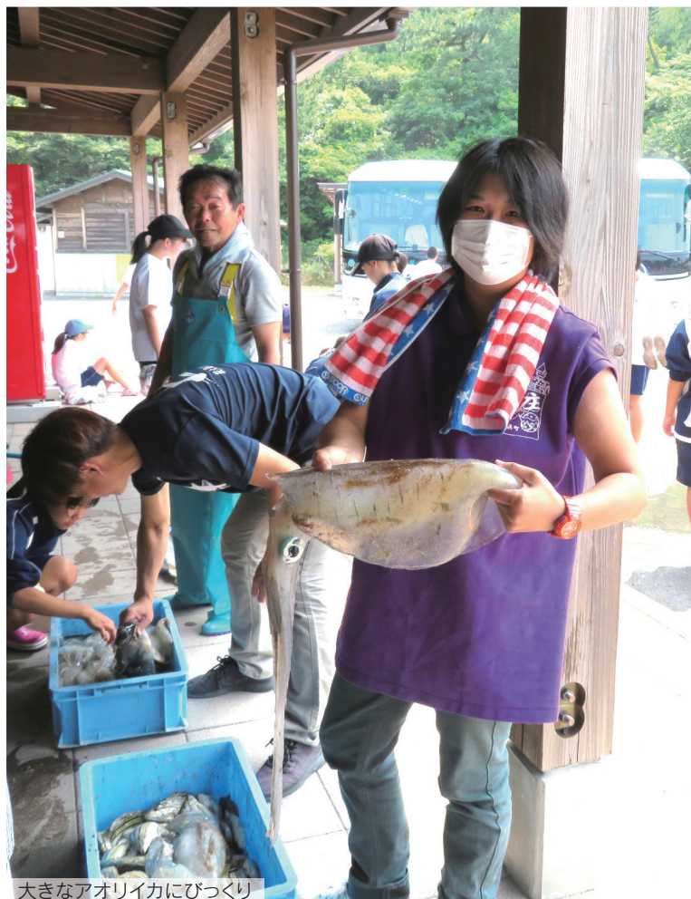
大きなアオリイカにびっくり