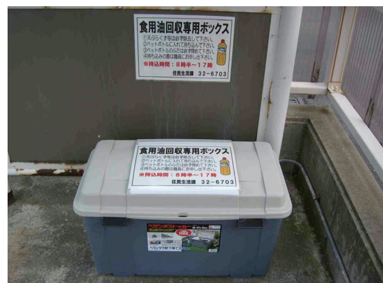
↑町内8カ所に設置している食用油回収専用ボックス