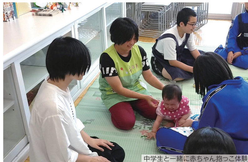
中学生と一緒に赤ちゃん抱っこ体験