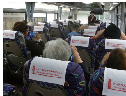
↑原子炉建屋内の様子をVRで疑似体験

12月12日には、北西郷公民館の公民館講座として18人の受講者が発電所を訪れ、VR（バーチャリアリティ）スコープを使用し、バス車内から発電所の全景のほか、原子炉建屋、タービン建屋の内部が見渡せる映像を見ながら、発電所の概要について学びました。