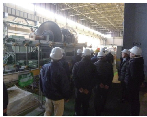
↑1・2号機のタービン取り外しの状況を視察

また、1月17日には、美浜町区長の研修に参加した区長が発電所を視察し、1・2号機のタービン建屋内の機器の解体の様子や、3号機の安全対策工事の内容・進捗状況等について説明を受けました。