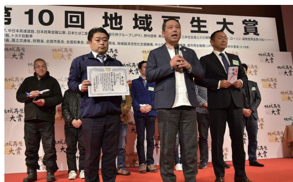
↑東京で行われた授賞式の様子

1 月25日に、町内で空家対策に取り組むNPO法人「ふるさと福井サポートセンター」が「第10回地域再生大賞」の大賞を受賞しました。 同賞は、地方新聞46社と共同通信社が人口減少や高齢化等の地域課題の解決に取り組む団体を全国で紹介しようと表彰しているものです。 同法人は、町と連携しながら全国的に増加している空家問題について取り組んでおり、空家と移住希望者を結びつけるマッチングツアーの開発や空家をデータベース化するアプリの開発、所有者に空