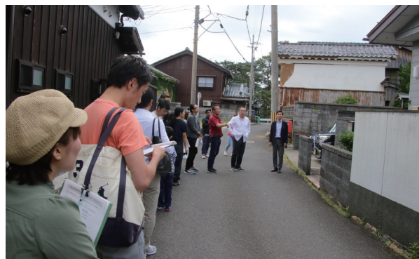
↑町内で行われている空き家マッチングツアー

1 月25日に、町内で空家対策に取り組むNPO法人「ふるさと福井サポートセンター」が「第10回地域再生大賞」の大賞を受賞しました。 同賞は、地方新聞46社と共同通信社が人口減少や高齢化等の地域課題の解決に取り組む団体を全国で紹介しようと表彰しているものです。 同法人は、町と連携しながら全国的に増加している空家問題について取り組んでおり、空家と移住希望者を結びつけるマッチングツアーの開発や空家をデータベース化するアプリの開発、所有者に空