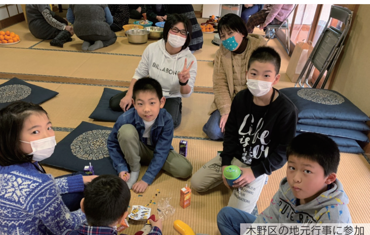
木野区の地元行事に参加