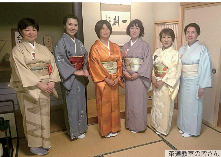
茶道教室の皆さん