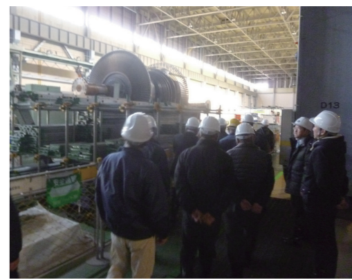
↑1・2号機のタービン取り外しの状況を視察

また、1月17日には、美浜町区長の研修に参加した区長が発電所を視察し、1・2号機のタービン建屋内の機器の解体の様子や、3号機の安全対策工事の内容・進捗状況等について説明を受けました。