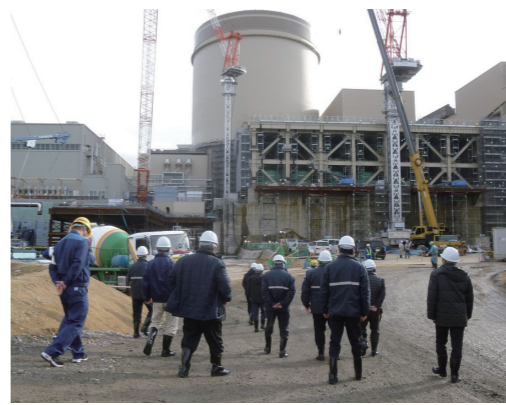
↑3号機周辺の安全対策工事を視察

町内の団体やグループ等で、1・2号機の廃止措置の状況や、3号機の安全性対策について、現地見学を希望される場合は、お気軽にお問い合わせください。