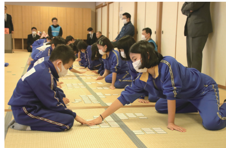
↓上の句が読まれた瞬間に取り札を取り合う児童

1月25日に、文化財火災防御訓練が歴史文化館(河原市)で行われました。 この訓練は、町民の文化財愛護に関する意識や防火意識の普及・高揚、消防職員の技術向上等を目的として美浜消防署が行ったものです。 訓練に参加した歴史文化館職員や消防団員らは、119番通報や初期消火等について学んでいました。