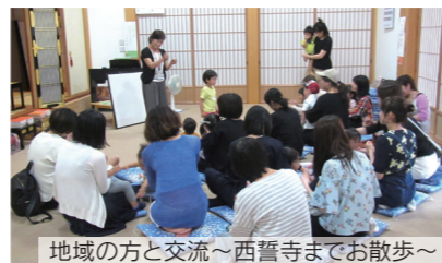
地域の方と交流～西誓寺までお散歩～