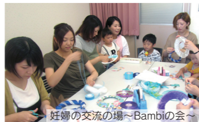
妊婦の交流の場～Bambiの会～