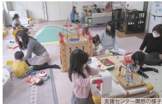
支援センター開放の様子

約12年間、子どもたちの遊び場として、保護者の方の集いの場として、多くの方々に利用いただきありがとうございました。4月からは、新しい施設でみなさんのご利用をお待ちしています！