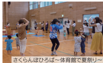
さくらんぼひろば～体育館で夏祭り～