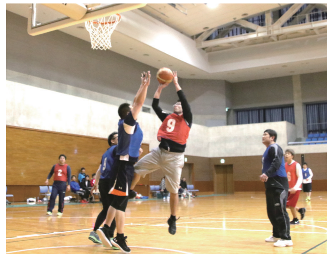
↓白熱した戦いが繰り上げられた決勝戦(佐田一久々子)