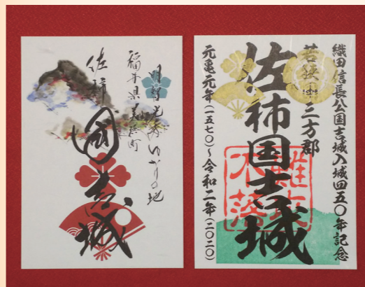
↑国吉城の令和2年版御城朱印