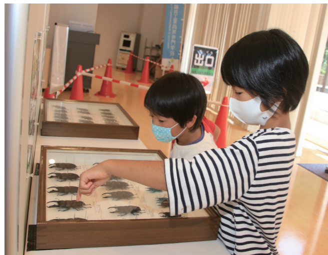
↓展示されたクワガタの標本を眺める子どもたち