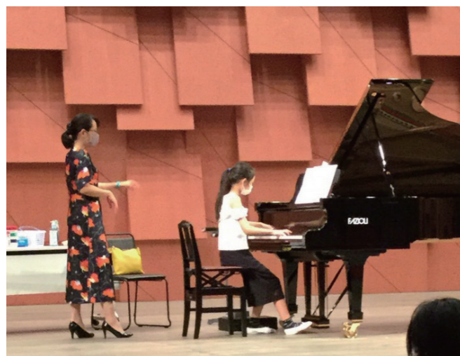
↓講師のアドバイスを聞きながらピアノを演奏する受講生