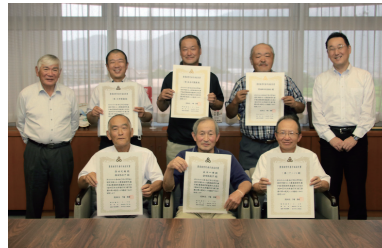
↓認定書を受け取った農業経営体の皆さん

8月5日に、排せつケア講習会が山野草の家（麻生）で行われました。（関連第19頁）この講習会は、適切なオムツの使い方を学んでもらおうと集落の要望に応じて町が開催しているものです。講習会の参加者は、実物を眺めながら、オムツを着ける際に気を付けることや自分に合ったオムツの選び方等について学んでいました。