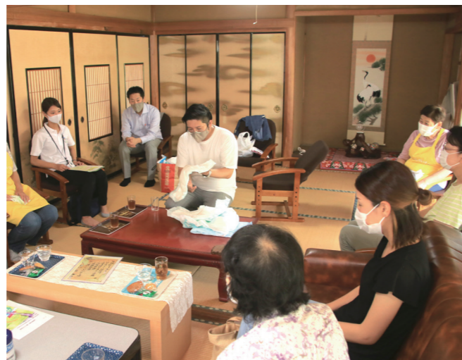
↓講師の説明を受けてオムツの使い方を学ぶ参加者たち

8月1日から10日にかけて「世界のカブトムシ・クワガタ展」がいばすで開催されました。夏休み期間に合わせた企画展として開催され、世界各地のカブトムシやクワガタの標本展示のほか、生態や種類等に関するお話しも行われました。訪れた子どもたちは、目を輝かせて珍しいカブトムシやクワガタの標本をのぞき込んでいました。