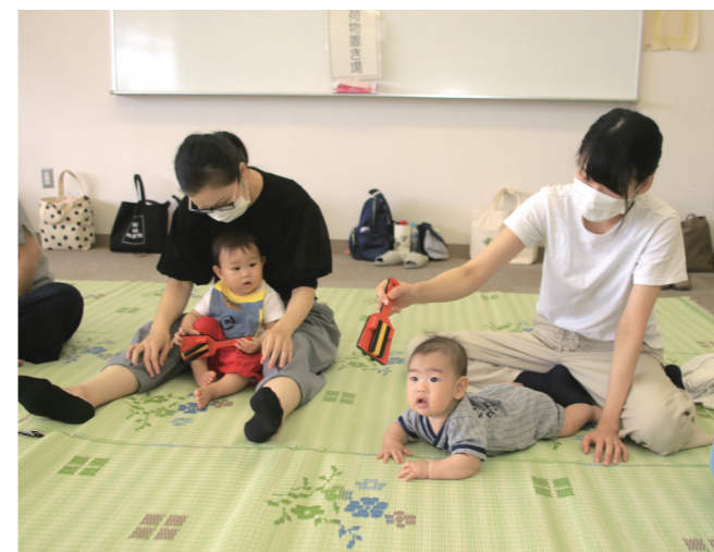
↓音楽に合わせておもちゃを楽しむ親子

8月4日に、なびあす講座「水辺の観察会」が町総合体育館横の奥新田湿地で行われました。同講座では、水辺の動植物についての学習や湿地の手入れ等を実施しています。参加者は、大きく育ったカキツバタやコウホネ等の水辺の植物の手入れをしたり、カニ等の生き物を見つけたりしていました。