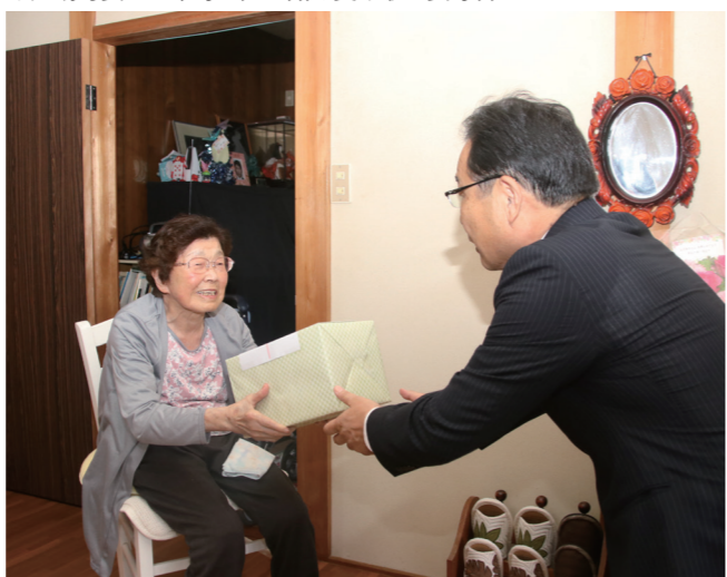
↓戸嶋町長から米寿の記念品を受け取る長寿者

9月23日に、町農業サポートセンターによる親子を対象とした野菜栽培体験が町役場で行われました。同体験は、子どもたちに食べ物大切さや野菜作りの楽しさ等を知ってもらおうと開催されたものです。参加した親子19組は、土を入れたプランターにラディッシュやスイスチャード等の品種を播種し、出来上がったプランターを持ち帰っていました。