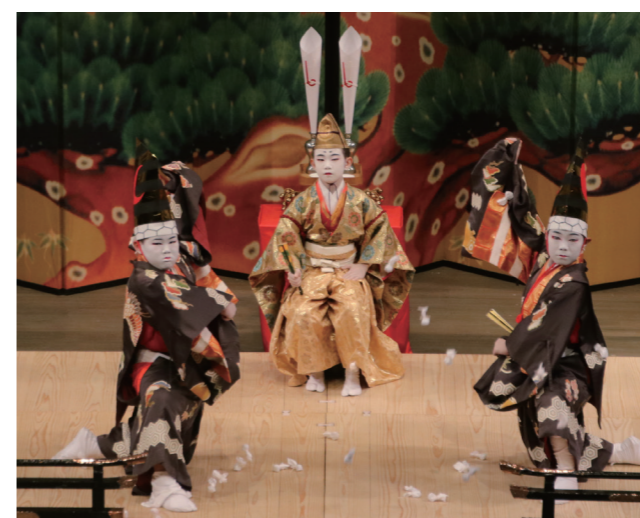
↓見えを切る「早瀬子供歌舞伎」の子ども役者

10月1日と2日に、戸嶋町長が町内の88歳(米寿)と99歳(白寿)以上の方を訪問しました。今年、町内で米寿を迎えられる方は、10月1日現在、男性21人・女性47人の計68人、白寿以上の方は男性3人・女性9人の計12人です。戸嶋町長は「これからもお元気で」と言葉をかけて長寿を祝うとともに、記念品を手渡していました。