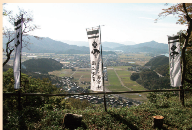
↑城山頂上(国吉城本丸跡)からの眺望

資料館から城山南麓の城主居館跡付近は標高が約40〜50mあり、城山頂上とは約150mの標高差になります。城主居館跡の石垣の上に立つと、佐柿の町並みや町の市街地を見渡せ、城山の麓ながら結構な高台だったことが分かります。この場所から、整備した城山遊歩道を約600m登ると頂上の本丸跡です。遊歩道は、急傾斜の城山の山肌を登るため、つづら折れの登り道が約200m続き、非常に苦労すると思います。疲れたときは、空を見上げてみましょう。木立の間から見える深みのある青い空と心地よいそよ風を感じながら一息つけます。