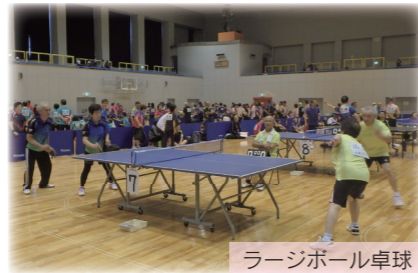
ラージボール卓球