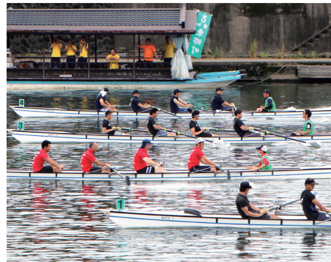
↓横一線で競り合う成年男子チーム「SR2BK」(奥から2艇目)