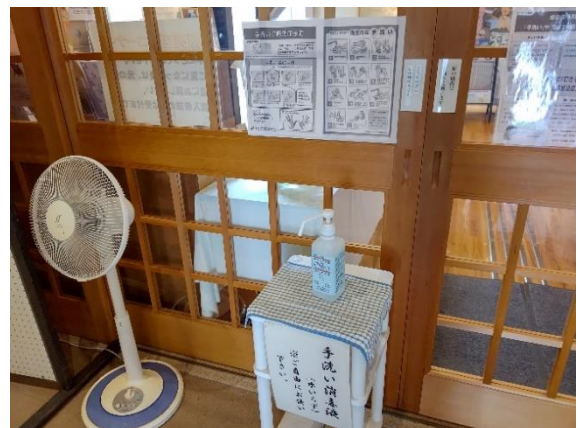
館内入口手洗い消毒液