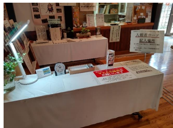
ご入館者様カード記入場所