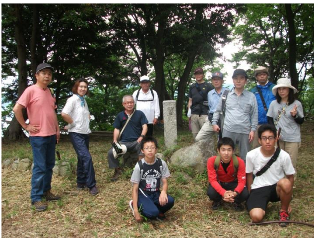
本丸跡で記念撮影

前日まで雨で、当日もいつ雨が降り出すかわからない天候で、参加者も 14 名と少なめでしたが、講座中は降雨もなく、受講生の皆さんは大野館長の案内で 2 時間半たっぷり国吉城址を満喫されました。