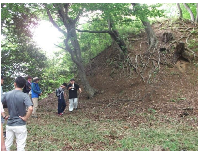
国吉城址を隅々まで踏査

平成 29 年度国吉城歴史講座の第 1 回「国吉城址に登ろう！」が、6 月 25 日（日）午前に開催されました。今回は、続日本 100 名城選定記念として、基本に立ち返って国吉城址を隅々まで見ようという内容で、普段は足を踏み入れない、青蓮寺谷や連郭曲輪群まで、本当に国吉城址の隅から隅までを見歩きました。