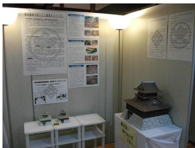
国吉城址のあらたな見どころを紹介

平成 29 年 4 月 22 日（土）から、春季トピックス展『国吉城址に登ろう！～国吉城址の見どころ紹介～』を、資料館エントランスホールを会場に開催しました（～7 月 23 日（日）まで）。