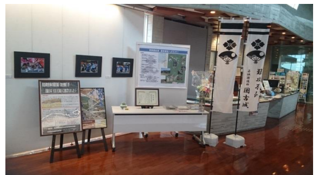
記念巡回展、美浜町生涯学習センターなびあす会場の様子

現在、国吉城の続日本100名城選定を記念した巡回展示を開催中です。6月15日から町役場でスタートし、なびあす、はあとびあと巡り、今後は観光協会（7/25～8/6）、歴史文化館（8/8～8/20）、きいばす（8/22～8/31）を巡回予定です。