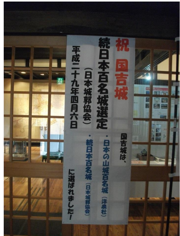
資料館玄関にも大きく掲示！

国吉城は、平成12年度から史跡整備を目指して発掘調査が始まり、数々の新発見によりイメージが全く変わりました。それらの成果を公開するため、平成21年に当館が開館しました。また、地元佐柿区の皆様によって、毎年「佐柿国吉城まつり」が開催されており、このような城跡を活かす取り組みが、「続日本100名城」選出に繋がったものと思われま。