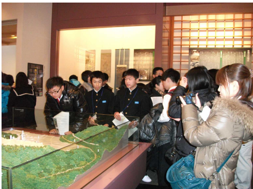
* 美浜中生と仲良く見学。