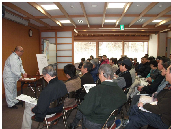
・皆さん、勉強熱心に耳を傾けておられました。