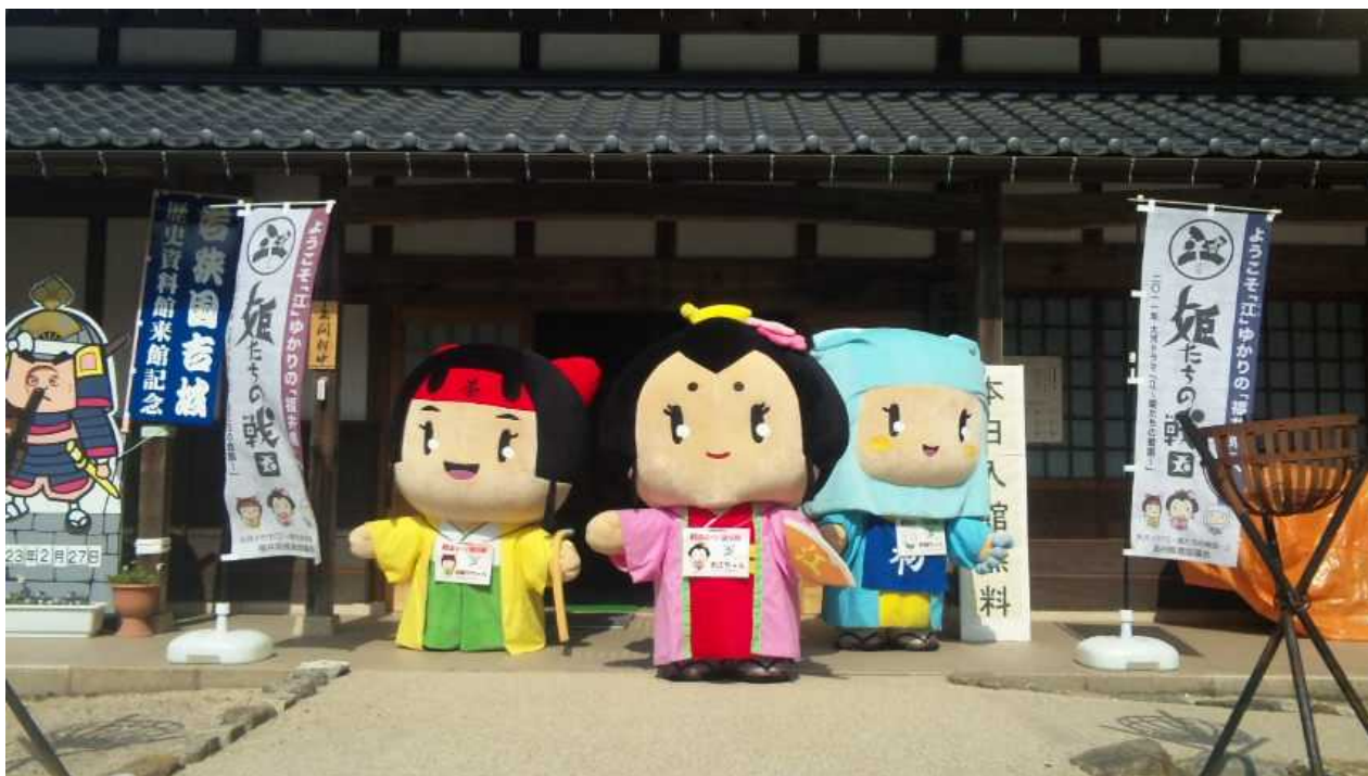
* 三姉妹が皆さんをお出迎え