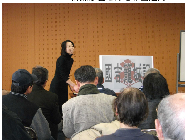
・国吉籠城戦の紙芝居もありました。