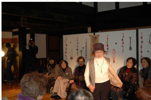
モデルは受講生の皆さん、古い木造のエントランスホールが会場です。和の雰囲気素敵です。