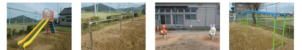
↑整備した遊具(すべり台、鉄棒、スプリングベット、うんてい)

※この事業は、(一財)自治総合センターが宝くじの収益の一部を財源として、宝くじの普及広報を目的に各種のコミュニティ活動を対象に助成するものです。