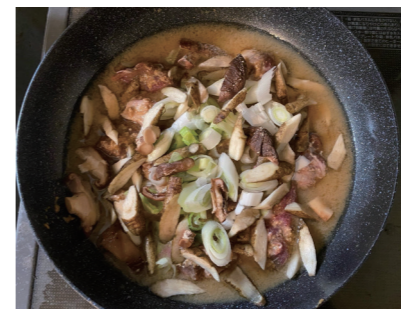
↑山の恵みたっぷりのほたん鍋

そのほか、食材ではないかもしれませんが、水にも感動しました。これまで日本各地を巡りましたが、これほど身近な場所においしい水がある場所は少ないのではないでしょう