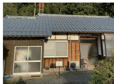
↑小料理屋(仮)のオープン予定地

この取り組みを考え始めたのは、美浜町の魅力的な食材に出会ったことがきっかけです。私が美浜に移り住