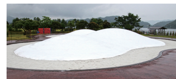
↑お披露目された遊具

6月16日に、にじいろパークのオープニングセレモニーが総合運動公園で行われました。 にじいろパークは、子どもたちへの遊び場の提供や町民の健康づくりを目的に整備されました。 オープニングセレモニーでは、町内3園の保育園児ら約60人が招待され、テープカットに合わせて風船を飛ばし、オープン祝っていました。