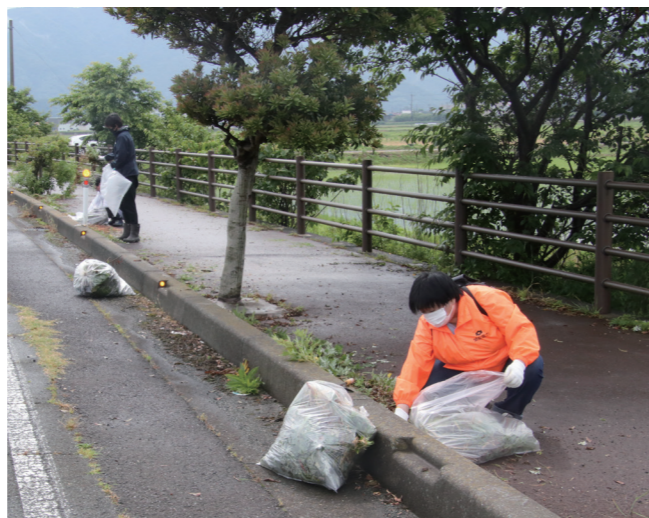
↓清掃活動を行う参加者たち

4月より、美浜中学校でタブレットを活用した授業が始まりました。 この取り組みは、文部科学省が進めているGIGAスクール構想の一環として導入されたもので、1人に付きタブレット端末1台が貸与されています。 生徒たちは、授業が始まるとそれぞれのタブレットを起動し、慣れた手つきで操作をしていました。