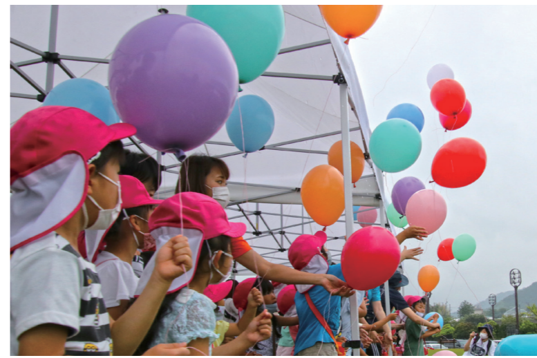
↓風船を飛ばす園児たち

6月13日に、クリーンアップふくい大作戦in美浜が県道や河川敷等で行われました。 この活動は、美しい浜プロジェクトやクリーン・ザ・シーキャンペーンと合わせて開催され、約470人が参加しました。 参加者は、それぞれの持ち場で空き缶やペットボトル等のごみ約2.2トン回収しました。(関連第9頁)