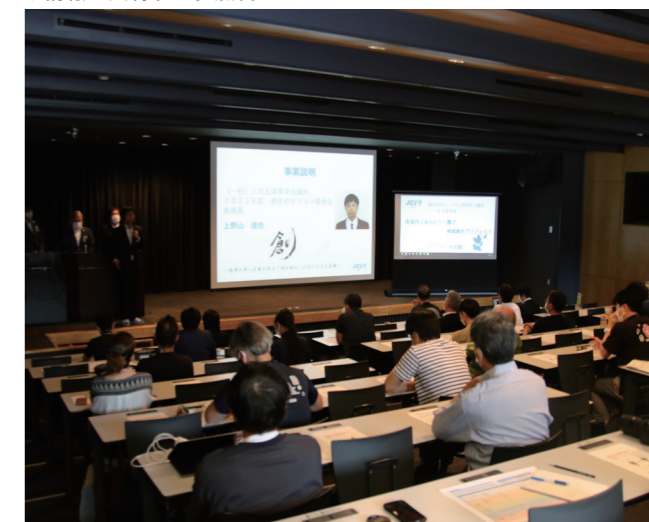
↓情報を共有する参加者たち

5月24日に、あおなみ保育園の5歳児が田植え体験を行いました。 この田植え体験は、園児が自分たちで苗を植えることで稲の成長に興味を持つとともに、地元の農家さんとふれあうことを目的として行われました。 園児たちは、自分たちの手で苗を植えた後、田植え機に乗り、機械による田植えを体験していました。