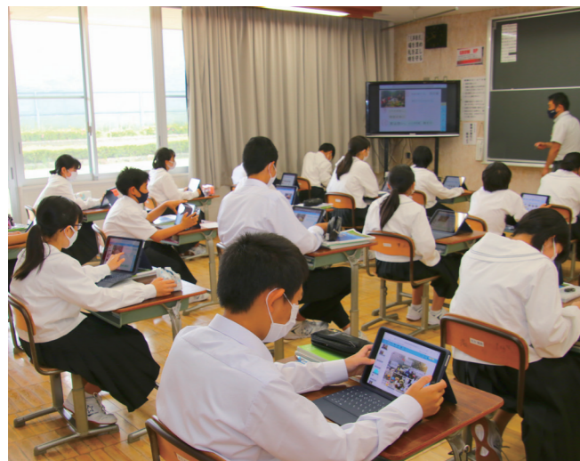
↓タブレットを使い授業を受ける美浜中学校の生徒たち