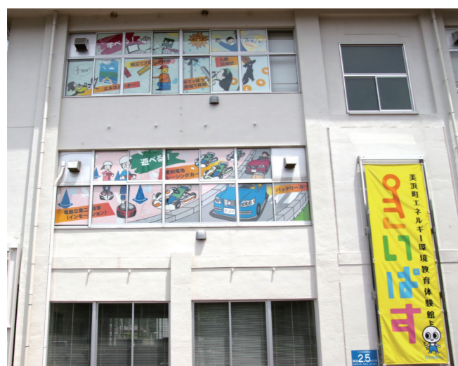
↓鮮やかな色彩で描かれたウィンドウサイン