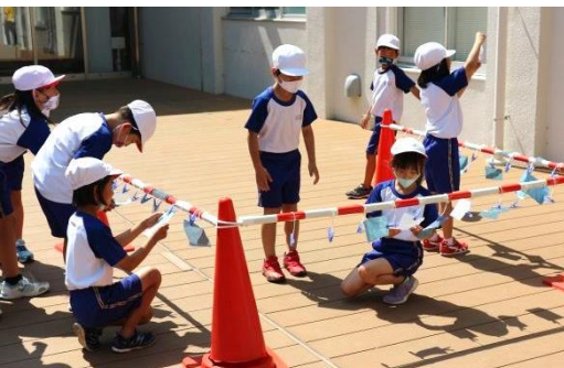
晴れた日なら、数分で写真が完成します。