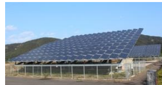
出力100kW (1基50kW) 一般家庭で使用する電力量 300kWh/月として、約34軒分の電力量を発電しました。