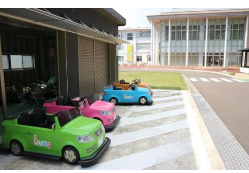
バッテリーカー体験は、入館せずに体験できるのも魅力！