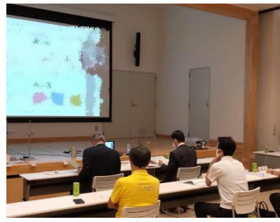
審査委員会はオンラインで開催しました。

9月24日に鯖江市東陽中学校3年生117名が校外学習で来館、エネルギー環境に関するクイズ大会などを体験しました。