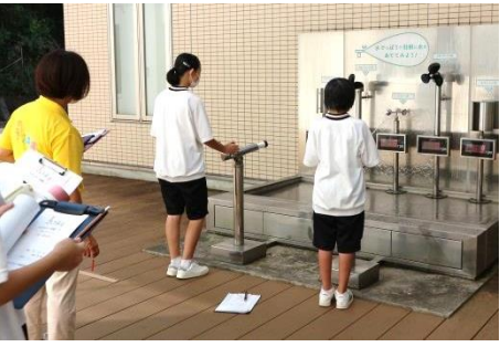
館内ツアー (水鉄砲的当て体験)の様子

9月24日に鯖江市東陽中学校3年生117名が校外学習で来館、エネルギー環境に関するクイズ大会などを体験しました。