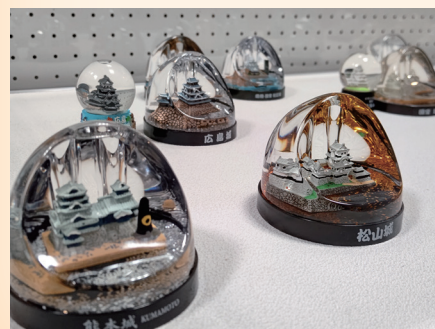
↑展示中のウォーター(スノー)ドーム

海外では「スノーグローブ」(Snow Globe)とも呼ばれ、その歴史は19世紀前半頃までさかのぼり、ヨーロッパでペーパーエイトの一種として誕生したといわれます。1889年のパリ万博では、小さなエッフェル塔を入れたスノーグローブが話題となり、万博土産として大人気になりました。 太平洋戦争前は、アメリカ製と日本製のスノードームが世界を二分するほどでしたが、戦争に突入した後は日本から輸出される事はなくなりました。 時代や国によって、中身のモチーフも変わっていききました。戦争の時代は飛行機や戦艦、兵士が、平和な時代は名所や風景、キャラクターものが流行しました。 世界的にも王道のお城グッズを、皆さまにも楽しんでいただきたいと思えます。ぜひ資料館にお越しください。(若狭国吉城歴史資料館)