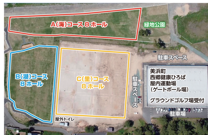
↑美浜町西郷健康ひろばグラウンドゴルフ場の全体図

活動の推進や各種大会の誘致による交流人口の拡大を図っていきます。 ※お問い合わせ先 町教育委員会事務局 (担当・武田) ☎32-6708