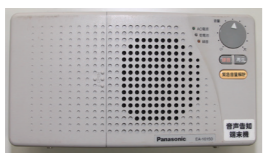
↑撤去する端末機本体