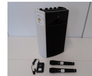
↑整備したワイレスアンプ等