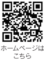
ホームページはこちら

※新型コロナウイルス感染症対策のため、受付期間や試験期日の変更となる場合があります。 ※期間や期日の変更された場合は、自衛隊福井地方協力本部のホームページでお知らせします。