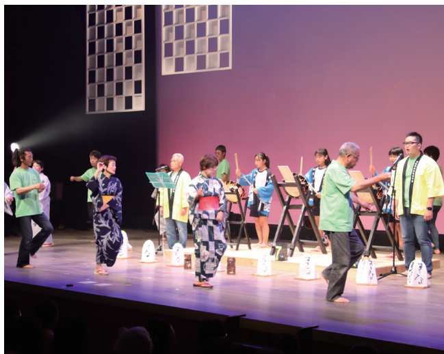
↓すてな踊りを披露する佐田伝統文化保存会の皆さん