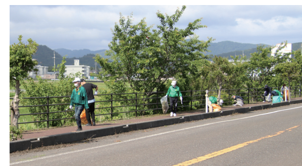
↑道路沿い(久々子)で草刈りやごみ拾いをする参加者