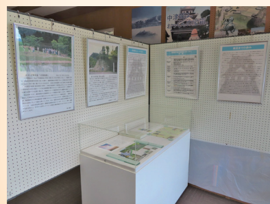
↑若越城の会30年の歩み①の様子(一部)

同会の特徴は「誰もが気軽に参加できること」であり、研究者だけでなく一般の愛好家も数多く入会していました。また、会員が城の調査・研究に取り組み、その成果を会報「若越の城館」に掲載する等、積極的な普及活動が続けられていました。同会の活動の成果は、現在の県内における城ブームの礎を築いたといえます。 また、城を通して同会と美浜町及び当館との交流が生まれました。過去には、同会の総会が当館で開催されたり、国吉城址や町内の城跡の見学会が当館の国吉城歴史講座と合同で開催されたりしました。これをきっかけに、同会の活動記録は閉会とともに当館に寄託されました。今年号では、その中から同会が初めて美浜町で開催した見学会の様子をご紹介します。 平成8年5月26日、同会が初めて美浜町の国吉城址を訪れました。同年、町は「文化財の保存・活用に関する専門委員会」を発足し、国吉城址の整備を提言しました。町が城跡の整備に向けて第一歩を踏み出した頃から、同会が国吉城及び城跡の保存・整備に関心を示していたことがわかります。 当日の天候は晴れで、本丸では若狭湾から吹く風が心地よかったです。地主・地元の有志らによって城跡の草刈りが行われており、比較的登りやすかったようです。いかに、地元住民が国吉城址を地域の遺産として、誇り高く思っていたかがうかがえます。