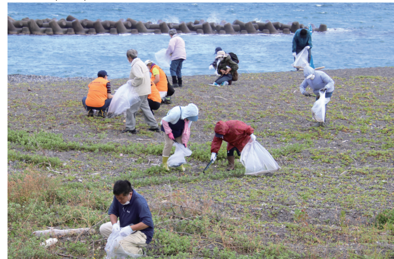
↓岩出浜(山上)を清掃する参加者

6月4日に、第35回町民ゲートボール大会が西郷健康ひろば屋内運動場で開催されました。 大会には、町内20チーム、約120人が参加し、各チームとも一丸となって、連携の取れた元気なプレーを繰り広げていました。 大会結果は次のとおりです。(関連第23頁) 優勝 久々子B 準優勝 菅浜B 3位 新庄B