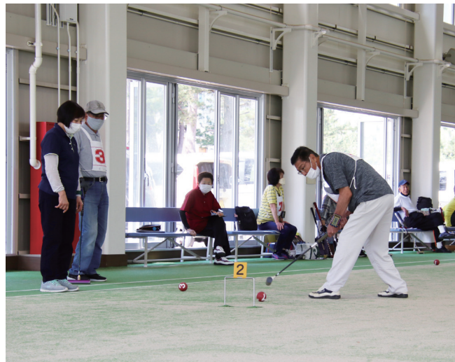
↓狙いすましたショットを放つ参加者

5月26日に、美浜中学校の1年生71人による海岸清掃が水晶浜で行われました。 この活動は、総合学習の一環で「ふるさとのために自分たちができることは何か」を考えるきっかけ作りのために行われました。 生徒たちは今後、町内各地域に分かれ、地域が抱える課題等の解決に向け、手助けをする活動を行う予定です。