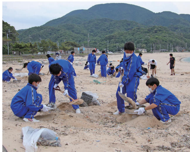
↓砂をふるいにかける生徒たち