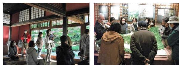
福井県観光連盟ツアーふくい (21名)