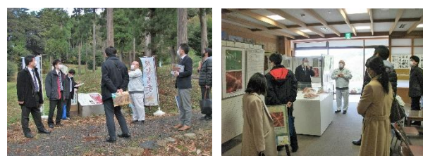
J R西日本 (12名)