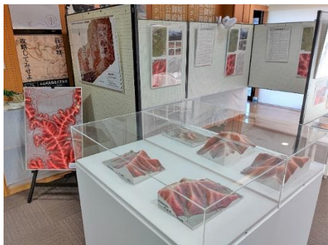
秋季企画展の展示会場 (学習室)