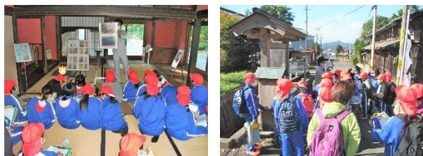
美浜西小学校5年生 (23名)