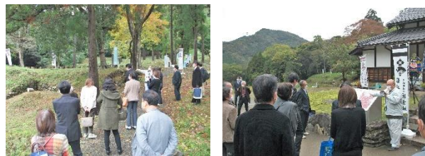
おおい町人権教育推進協議会 (18名)