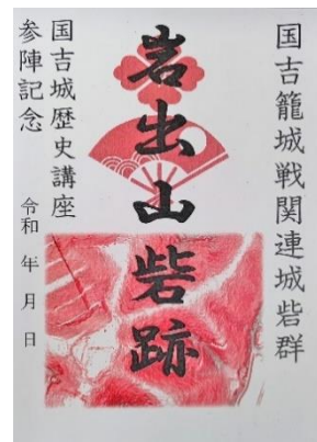
国吉籠城戦関連城砦群 「岩出山砦跡」御城朱印

第6回では、国吉城の出城といわれる岩出山砦跡を赤色立体地図に表現された地形と見比べながら見学しました！同砦跡は美浜町坂尻にあり、国吉城址がある城山の北東に位置する丘陵の頂上部に遺構があります。本講座では、いかに赤色立体地図に実際の地形が詳細に表現されたのかを体感していただくとともに、新たに分かった岩出山砦の姿につ