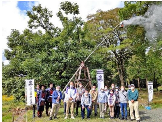
当館復元烽火台にて