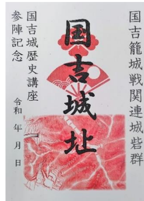
国吉籠城戦関連城砦群 「国吉城址」御城朱印

第5回では、敦賀市の歴史愛好団体「敦賀歴史倶楽部」との共催による「元亀騒乱の初戦！金ヶ崎の戦い狼煙上げ！」においてリレー形式でのろしを上げました！元亀元年(1570)、織田信長による越前朝倉攻めにおいて天筒山・金ヶ崎の両城を攻め落とした場面をのろし上げで再現しました。午前10時