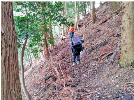
伝二ノ丸下旧城道?