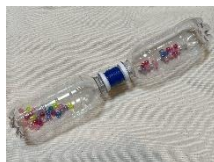
リズム楽器「ペットマラカス」