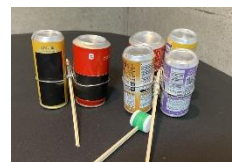
打楽器「カンブロック」