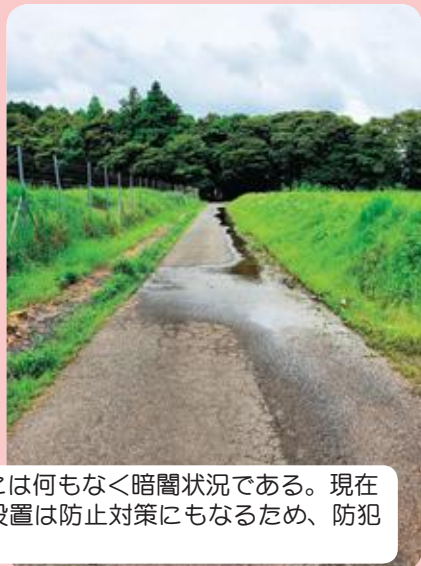
■集落裏道に防犯灯設置工事を要望（佐田地区）

近年道路の交通量が増加し、周りには何もなく暗闇状況である。現在ごみの不法投棄もあり、防犯灯の設置は防止対策にもなるため、防犯灯設置工事を要望。