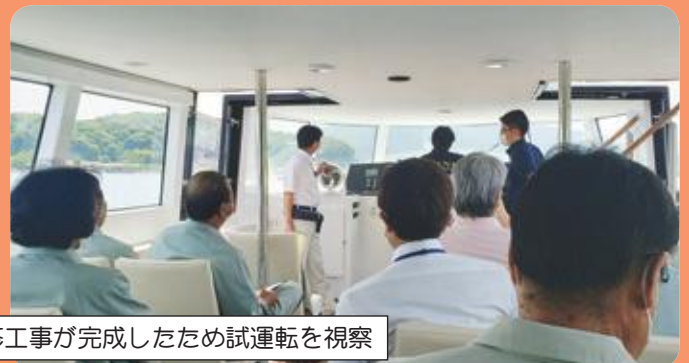
■電池推進遊覧船（1隻目）の内外装飾改修工事が完成したため試運転を視察