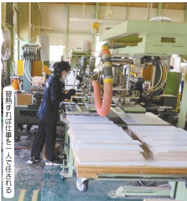
習熟すれば仕事を一人で任される