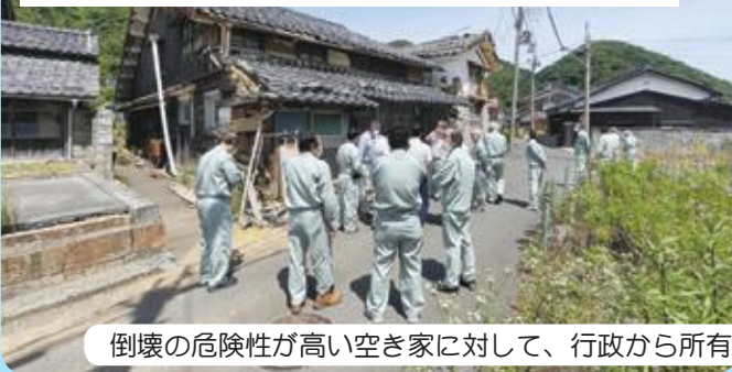
美浜町内で大変大きな問題になっている空き家問題

倒壊の危険性が高い空き家に対して、行政から所有者に特定空き家助成金制度等の説明と指導強化の要望。