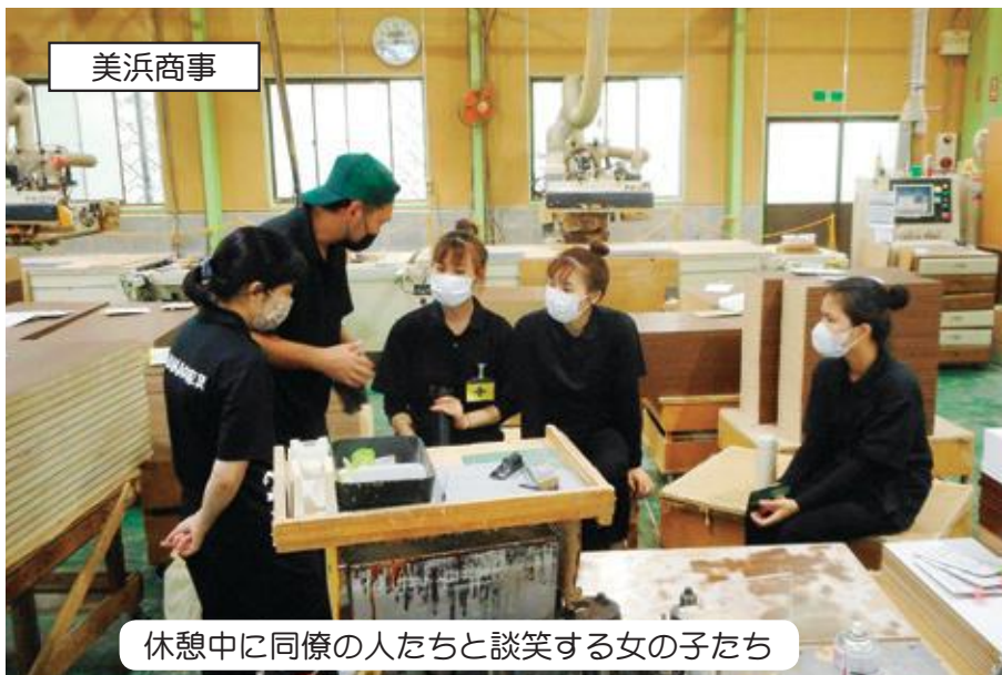
休憩中に同僚の人たちと談笑する女の子たち