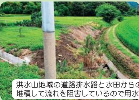
■用水路改修要望（郷市地区）

長年の放置で倒壊などの危険性がある老朽空き家が存在し、いつ人身事故が発生しても不思議ではない状態なので、行政の安全なる管理を要望。