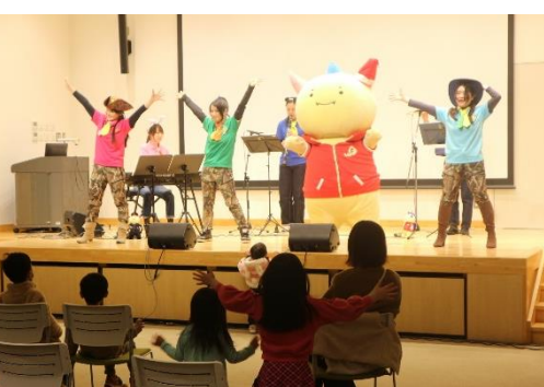
はびりゅう登場に会場は大いに盛り上がりました。

17日に福井県による「はびりゅう体操コンサート」がきいばすで開催されました。プロミュージシャンの生演奏に合わせ、体を動かしながら楽しみました。(参加者数40名)