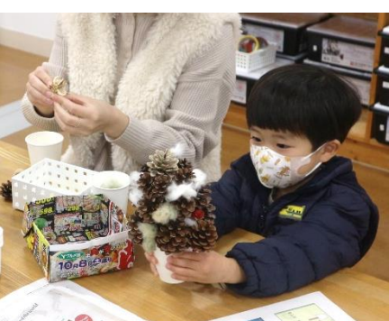
綿の美がアクセントになったツリー

出力100kW (1基50kW) 一般家庭で使用する電力量 300kWh/月として、約25軒分 の電力量を発電しました。