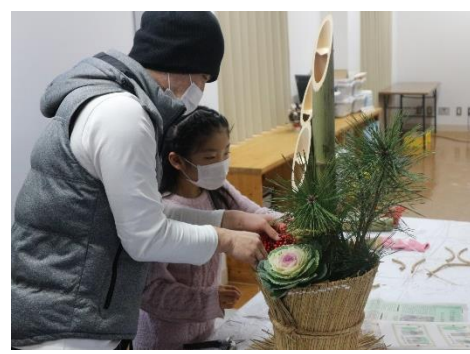
松の葉や南天を飾り付ける参加者

17日に福井県による「はびりゅう体操コンサート」がきいばすで開催されました。プロミュージシャンの生演奏に合わせ、体を動かしながら楽しみました。(参加者数40名)