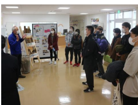
きいばす職員から説明を受ける大学生

11日にクリスマススクラフト教室を開催しました。松ぼっくりやドライフラワーなどを使ってクリスマスツリーを作りました。(参加者数16名)