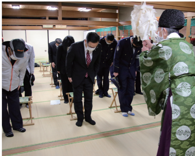
↓ 今年1年間の交通安全を祈願する参加者の皆さん

1月1日に、板の魚の儀が稲荷神社(日向)で行われました。 この神事は、その年の海上安全と豊漁を祈願するために毎年元旦に行われているものです。 区民約40人が見守る中「若い衆」と呼ばれる袴姿の児童2人が、今年の恵方の南南東を向き「大漁、大漁、大漁」と声をあげ、板の上の鯖を見事にさばきました。