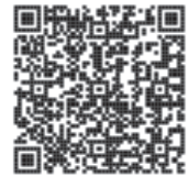
インボイス制度特設サイトはこちら

10月1日からインボイスを交付するためには、原則として3月31日までに登録申請を行う必要があります。詳細等のお問合せは、国税庁ホームページ内に開設しているインボイス制度特設サイトをご覧ください。※登録は事業者の任意です。