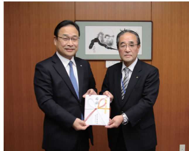
↓ 戸嶋町長(左)に目録を手渡す坊理事長(右)