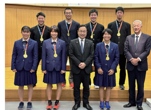
↑報告に訪れた選手たち