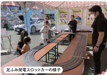
足ふみ発電スロットカーの様子