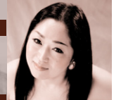
魔女: 東 園