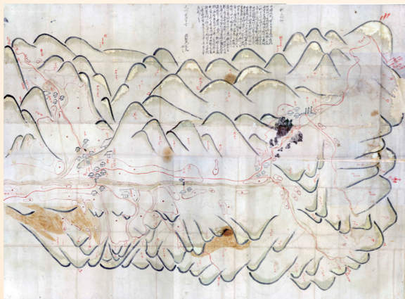
↑新庄村絵図(個人所蔵)