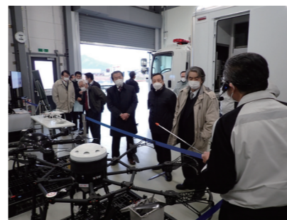
↑美浜原子力緊急事態支援センター

原子力研修センターは、原子力発電所の保修、点検作業の技術向上を図るため、実際の原子力発電所と同じ設備・機器を備え付け、教育・訓練を実施する施設です。委員は、実技訓練、専門知識・技能習得等の研修内容を確認すると