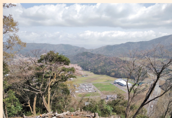
↑本丸から朝倉氏が築いた中山の付城が望めるように

城の新たな魅力を創り出すことができたと思います。なお、このライトアップは遠くからお楽しみいただくものです。夜間の城山登山は大変危険ですので、ご遠慮ください。また、曇りや雨の日は十分に蓄電されず、点灯時間が短い、または点灯しないこともあります。その他、当館では夏休みに親子で体験できるワークショップを計画中です。この夏、多くの方のご来城をお待ちしています。