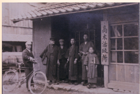
↑高木活版所(河原市 大正7年)

なつたのも明治時代のことでした。以後、会社や省庁の書類や学校のお知らせ等が、手作業で印刷されるようになったのです。このように先人達の技が生み出した数多くの印刷物は、貴重なメディアとして社会の形に影響を及ぼしてきました。また一方で、印刷物はその変遷を含めて、時々の歴史文化を後世に伝える貴重な記録としての役割を担ってきました。「印刷と歴史展」では、木版等の印刷に用いられた資料と印刷された資料を併せて展示しています。急速に技術が高度化している今、改めて往時の印刷と歴史に及ぼした影響への関心が深まれば幸いです。ぜひ、10月29日までの会期中にご来館ください。(美浜町歴史文化館)