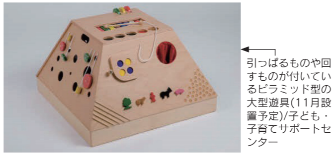
引っぱるものや回すものが付いているピラミッド型の大型遊具(11月設置予定)/子ども・子育てサポートセンター