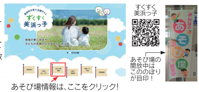
あそび場情報は、ここをクリック！