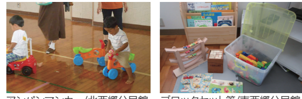
アンパンマンカー/北西郷公民館 ブロックセット等/南西郷公民館

町内のあそび場を子どもたちが楽しめる場所にするため、新たにおもちゃ等を購入しました。各あそび場の詳細は、あそび場情報サイトで紹介していますので、遊ぶ場所を選ぶ際の参考にしてください。