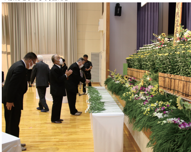
↓献花をする参列者たち

9月24日に、三方五湖一斉清掃が行われました。この活動は、三方五湖の環境と景観の保全を目的に、三方五湖保全対策協議会が開催したもので、町内外の団体や企業等22団体、約170人が参加しました。参加者は、久々子湖や日向湖等の周辺道路・側溝等に落ちているごみを拾い集め、可燃ごみや不燃ごみ等、約4.5㎡を収集しました。