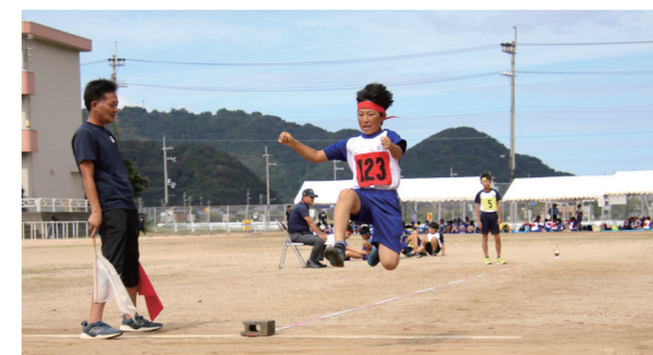
↑走り幅跳びをする児童

10月4日に、美浜町小学校陸上運動発表会が美浜西小学校で開催されました。発表会では、町内3つの小学校の児童が100m走や走り幅跳び、走り高跳び、ボール投げ、長距離走、リレーの競技に出場しました。児童たちは、自己ベストの更新を目指し、練習の成果を存分に発揮していました。