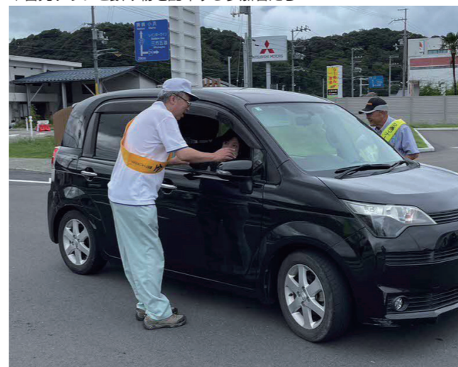
↓啓発チラシと飲み物を配布する参加者たち