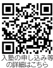
入塾の申し込み等の詳細はこちら

この度、子どもたちのやってみたいを発見し、実現する場として挑戦を後押しする美浜町公設塾「放課後教室サン」を開校します。