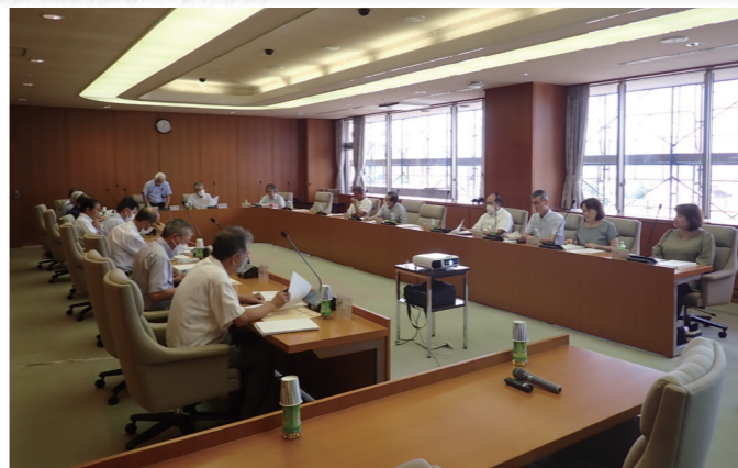
↑ 第217回美浜町原子力環境安全監視委員会

9月4日に、第217回美浜町原子力環境安全監視委員会を町役場で開催しました。今回の委員会では、発電所の周辺環境への影響等に関する福井県原子力環境安全管理協議会の報告内容を説明しました。また、美浜発電所の現状等について、関西電力(株)に説明を求めるとともに、ふげん・もんじゅの廃止措置状況や新試験研究炉の検討状況について、原子力機構に説明を求め、それぞれのプラントの現状等を確認しました。