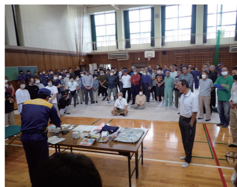
↑非常用持出袋の説明(美浜東小学校)

10月1日に、東地区を対象とした防災訓練を実施しました。 この訓練は、地域防災力の向上を図ることを目的として、自主防災組織を中心とした災害発生時の防災力強化と町民の自主防災意識の高揚を図り、災害発生時の行動や連絡体制の確認を行いました。災害の想定は、東地区を中心に雨が降り続き、大雨(土砂災害)警報が発表され、今後も降雨が予想される中、敦賀半島に線状降水帯が発生し、竹波地区で土砂崩れも発生し、県道が通行不能になったとの想定で訓練を行いました。 訓練の内容は、屋外スピーカーや戸別受信機、防災アプリ