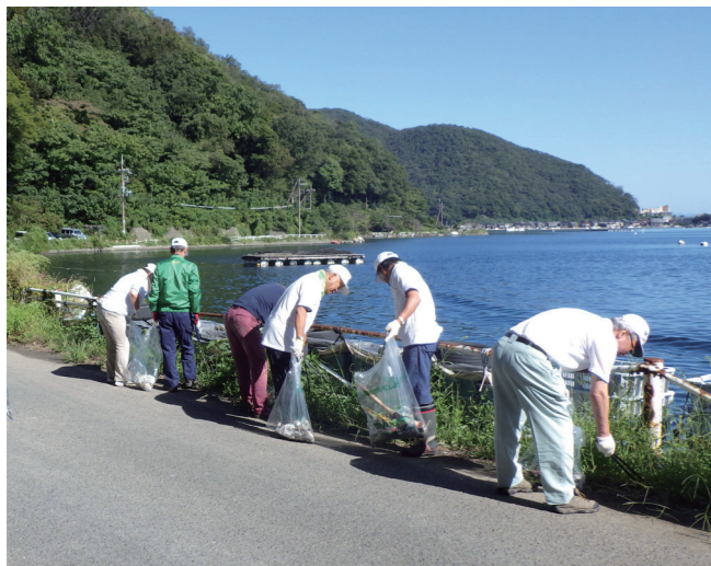
↓日向湖沿いのごみを拾う参加者たち