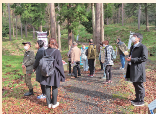
↑「ふくいお城めぐりバスツアー」のモニターツアー(令和4年12月13日当館撮影)

ベントや旅行の企画、グッズやSNS等を通じてお城の魅力を発信し、行政や保存会、観光協会等は城跡の整備にも取り組んでいます。このように多様化した現代のお城巡りに合わせて、県内でもさまざまな事業が実施されています。国古城に関係した事業の一部をご紹介します。 令和3年5月、県内の城の魅力を広め、観光資源としての活用を進める「ふくい城巡りプロジェクト」が発足しました。本町もこれに加盟し、当館と合同で開催した国古城址の見学会や同プロジェクトと福井県観光連盟が企画した「ふくいお城めぐりバスツアー」のモニターツアー等で国古城の魅力をPRすることができました。 本年11月3日、4日には、福井市の福井商工会議所ビルで「ふくい城巡りフェス」が初めて開催され、県内の城郭関連団体が一堂に会し、国古城を含む福井の城の魅力をさまざまな催しで発信します。 また、福井県嶺南振興局が発行した「若狭路城跡めぐりガイドブック」は、JR小浜線を利用して嶺南6箇所の城跡を巡る各コースが紹介されており、国古城址を巡るコースも掲載さ