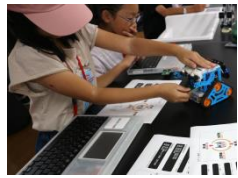
自分で考えたプログラムで ロボットを動かします。