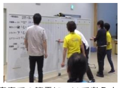
家庭での節電について考えます。