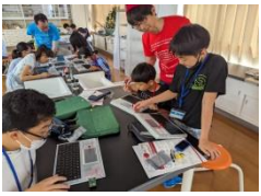
初めて挑戦するみなさんも、 楽しみながらぐんぐん上達！