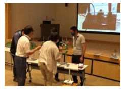
直流と交流の違いを体験。