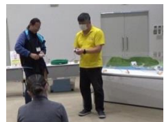
電気の需給バランスを体験。