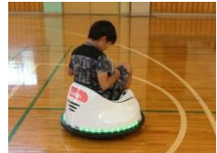
自動運転プログラムも作りました。