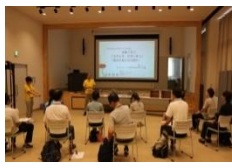
日頃から、エネルギー 環境教育に熱心な皆様。 活発な意見交換となり ました。

18日~19日に、令和5年度さ いはす新プログラム体験会を開 催し、県内外の教員10名の皆さ んにご参加いただきました。中 学生以上の団体にアレンジし た新プログラム「エネルギーを 賢く使う」「電気を届ける仕組 み」を体験いただき、わかりや すい展開や見やすさについて、 ご意見をいただきました。 今後の団体受入れに、活かし ていきます。