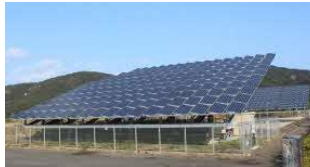
出力100kW (1基50kW) 一般家庭で使用する電力量 300kWh/月として、約44軒分の 電力量を発電しました。