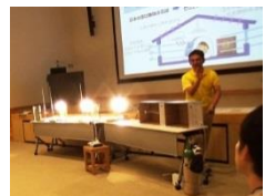
ゼロエネルギー住宅の設備を体験。