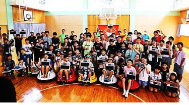
参加者の皆さん勢揃い。前列の乗物は 子ども自動運転車教材「Radish」。