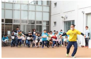
<100人だるまさん転んだ> おもしろポーズで止まった人にも 賞品がありました。 (遊Viva美浜プログラム)