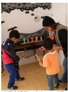
<切り紙ワークショップ> 素敵な作品がいっぱい！ 作った作品で遊ぶ当てゲーム も楽しみました。 (遊Viva美浜プログラ ム)