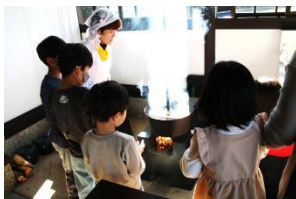
<かまど炊き体験> ガラスのふたなので、ご飯が炊け る様子に興味津々でした。