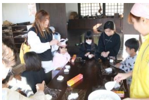
炊きたてのご飯で、おにぎりづくり も。大きなおにぎりが、たくさん できました。