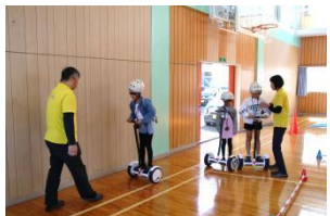
<インモーションの無料体験> 初めての人も、スタッフのサポート で、すぐにスイスイと。