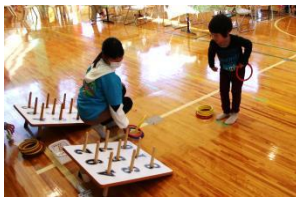
<子供屋台わなげ> 子どもたちが運営する屋台も活躍。 お客さんを上手におもてなし！ (遊Viva美浜プログラム)

29日に「秋のきいばすフェス タwith遊Viva」を開催 しました。今回、初めての試み となる遊Viva美浜とのコラボ イベントとして実施しました。 これまでのイベントと比べて 多くの出店があったことから、 子どもも大人も楽しめるイベン トとなり、町内外から、大勢の お客様にご来館いただきました。 (来館者約400名)