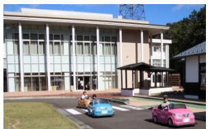
<バッテリーカー無料体験> お天気に恵まれ、最高のドライブ 日和となりました！

出力100kW (1基50kW) 一般家庭で使用する電力量 300kWh/月として、約35軒分 の電力量を発電しました。