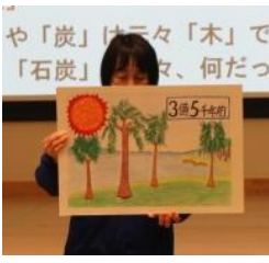
化石燃料が、どのようにつく られたのかを学べる紙芝居

では、今も地球上のどこかでつ くられているのでしょうか。答え は「×」です。これらは限られた 資源のため、私たちは大切に使う ていかなければならないことも学 びます。