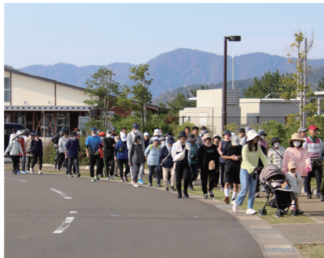
↓土井山を目指し、こるばを出発する参加者たち

11月10日に、幼年消防クラブ防火教室があおなみ保育園で開催されました。同教室は、園児たちに正しい消防の知識を身に付けてもらおうと、美浜消防署が実施しているものです。園児たちは、避難訓練や消防車の乗車、防火服の着装、防火紙芝居、カードゲーム等を通して、楽しみながら知識を深めていました。