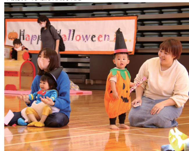
↓仮装して参加した親子たち