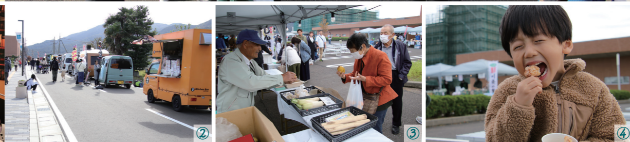
①地元の特産品や地域住民による出店ブース ②キッチンカー・ストリート ③野菜の販売 ④唐揚げを頼る来場者 ⑤屋台村 ⑥ジュニア吹奏楽団 ⑦福井伝統工芸アイドルさくらいと ⑧ほくりくアイドル部 ⑨若狭ウインドアンサンブル ⑩世界中に管楽器の魅力伝える管楽器ガールズユニット MOS