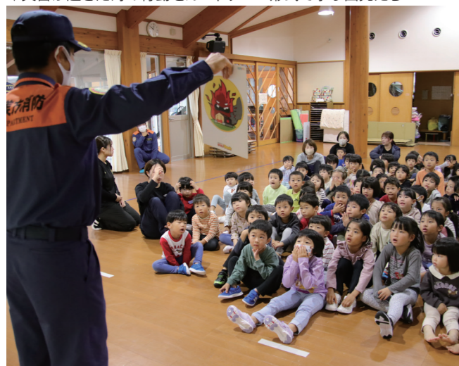
↓災害が起きた時の行動をカードゲーム形式で学ぶ園児たち

11月5日と12日に、美浜中央小学校の5年生による白ネギの販売がはまびよりで行われました。この取り組みは、ふるさと美浜元気プロジェクトの一環で行われ、町内で農業を営むグランファーム㈱の協力を得て自ら栽培した白ネギを販売しました。児童たちは、「おいしいネギはいかがですか」と声かけをして、消費者への接客を学んでいました。