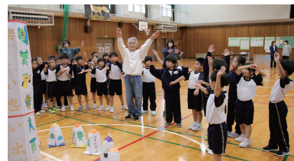
↑河童踊りを教わる児童たち

10月27日に、美浜東小学校の1、2年生が昔ながらの伝統的な遊びや河童踊りを体験しました。当日は、佐田伝統文化保存会のメンバーが講師として、児童たちにさまざまな遊び等を教えました。児童たちは、講師の手ほどきを受けながら、どんぐりのこま作りや紙飛行機作り、佐田伝統文化保存会が河童伝説をもとに作成した河童踊り等を体験していました。