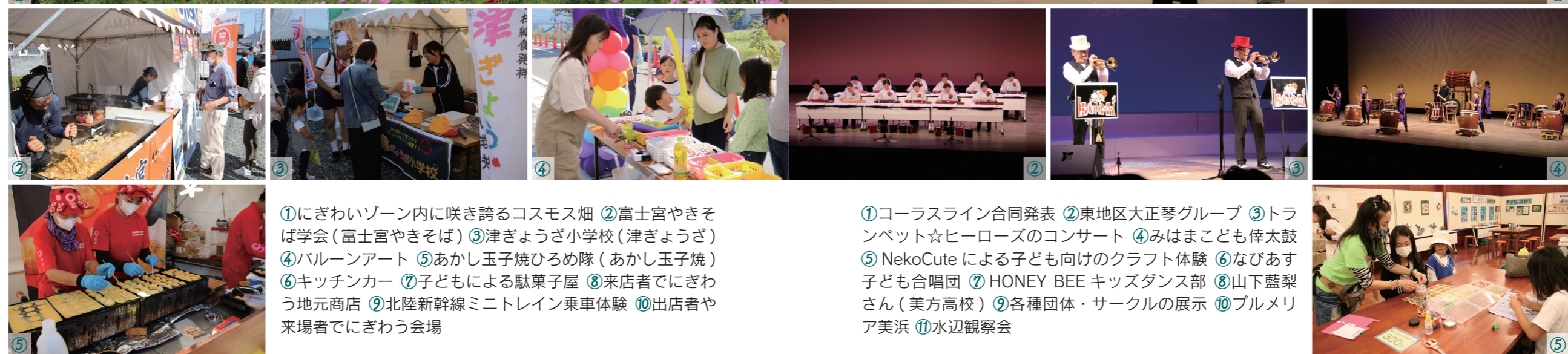
①にぎわいゾーン内に咲き誇るコスモス畑 ②富士宮やきそば学会（富士宮やきそば） ③津ぎょうざ小学校（津ぎょうざ） ④バルーンアート ⑤あかし玉子焼ひろめ隊（あかし玉子焼） ⑥キッチンカー ⑦子どもによる駄菓子屋 ⑧来店者でにぎわう地元商店 ⑨北陸新幹線ミニトレイン乗車体験 ⑩出店者や来場者でにぎわう会場