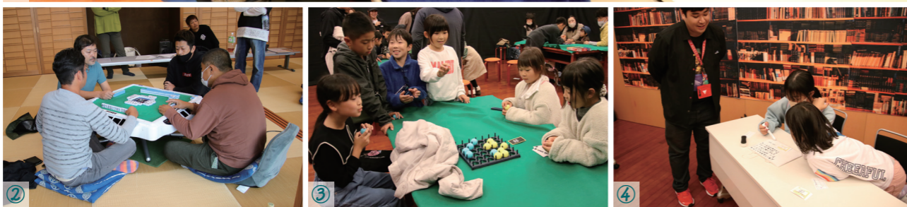
①ぶよぶよeスポーツ(ぶよぶよテトリス) ②マージャン大会 ③ボードゲーム体験 ④謎解き部屋 ⑤クラフトマーケット ⑥フリーマーケット(古着販売) ⑦HADO MONSTER BATTLE ⑧ステージイベント(K'z_Heaven) ⑨ステージイベント(JBスタジオ)