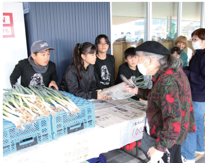
↓白ネギを販売する児童たち