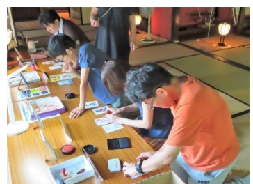
②「オリジナル御城朱印を作ろう」の様子(左:7/30、右:8/13)