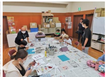
①「国吉城ペーパークラフトを作ろう」の様子(左:8/6、右:8/11)