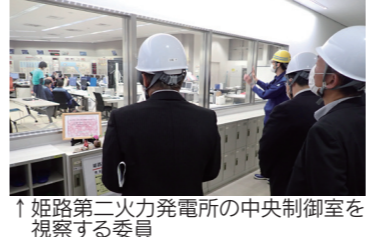
↑姫路第二火力発電所の中央制御室を視察する委員

姫路第二火力発電所では、ガスタービンと蒸気タービンを組み合わせた高効率のコンバインドサイクル発電について学びました。安全対策や地域産業の振興等、火力と原子力における取り組みの違い等を確認しました。