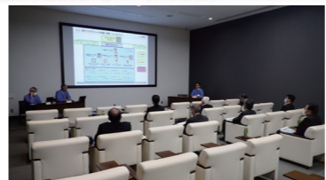
↑神戸造船所で説明を聞く委員

町原子力環境安全監視委員会は、委員会活動の参考とするため、11月10日に三菱重工(株)神戸造船所と関西電力(株)姫路第二火力発電所の視察を行いました。 神戸造船所では、蒸気発生器や使用済燃料乾式貯蔵キャスクの製造現場を確認し、機器の品質の確保に向けた取り組み状況等を確認しました。また、革新軽水炉の概要について説明を受け、更なる安全性の向上に向けた新たな技術や取り組み等を学びました。