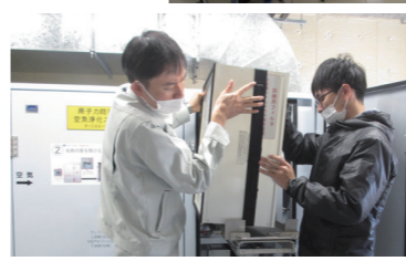
←訓練用フィルタの設置

今年度は、11月22日に、竹波原子力防災センター及び美浜中央小学校を対象とした研修を実施し、机上で各施設の整備経緯や概要を確認するとともに、放射性物質を除去するフィルトリングシステムの操作方法等を確認しました。