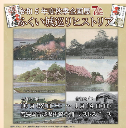
令和5年度秋季企画展 7 ふくい城巡りヒストリア 令和5年10月23日(土)〜1月14日(日) 若狭国吉城歴史資料館 レストスペース

れたり模擬天守閣が建設されたりと、城跡は市民の憩いの場として、また郷土愛醸成の場としての役割を担いました。やがて交通機関が発達し、観光旅行の需要が高まると、城跡は桜の名所として旅行パンフレットで紹介され、多くの人々が見物に訪れるようになりました。近代の県内における代表的な観光地として、江戸時代までの名所に加え、城跡が挙げられるようになりなりました。当時のパンフレットには、福井・丸岡・大野・小浜の近世城跡に加え、嶺北では一乗谷城跡や柴田勝家の北庄城址(福井市)、嶺南では金ヶ崎・高浜の各城跡等が紹介されています。このうち、すでに紹介した近世の各城跡と一乗谷・金ヶ崎の各城跡は、桜の名所として紹介されました。また、高浜城が築かれた城山とその周辺は、室町幕府三代将軍足利義満も見物したと伝わる「高浜の八穴」と呼ばれる奇岩を見物できる名所として現在も知られています。