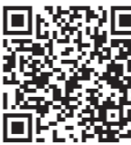
↑みち情報ネットふくい