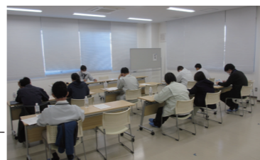
竹波原子力防災センターでの説明→

町では、原子力発電所での万一の事故等に備え、町内8カ所に「放射線防護対策施設」を整備しており、原子力災害時には同施設の運営を主に町職員が担う計画となっています。 このため、施設の設営及び運営が必要となった際に迅速かつ適切に運営作業が行えるよう、定期的に運用研修を実施しています。