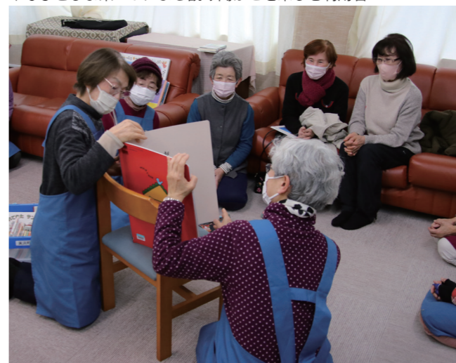
↓なびとしよ菜 Lib による読み聞かせを楽しむ利用者

1月14日に、町民バスケットボール大会が総合体育館で行われました。 大会には、5チーム約60人が参加。試合は、8分4ピリオドのトーナメント戦で行われ、各チームとも素早いパス回しやドリブルを駆使してゴールを決めていました。 大会結果は、次のとおりです。 優勝 久々子 準優勝 佐田 第3位 河原市、けやき台