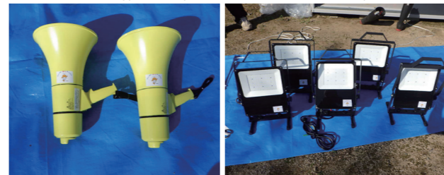
↑防災用資機材((左から)拡声器、投光器)