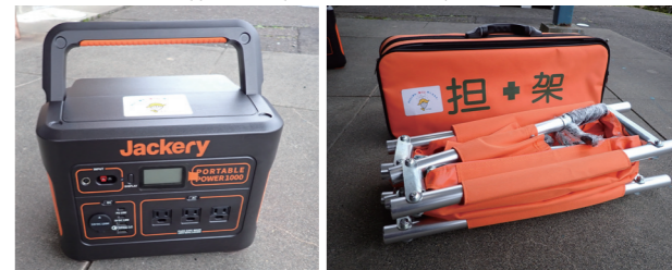
↑防災用資機材((左から)ポータブル電源、担架)

※この事業は、財団法人自治総合センターが宝くじの収益の一部を財源として、宝くじの普及広報事業を目的として各種のコミュニティ活動を対象に助成するものです。