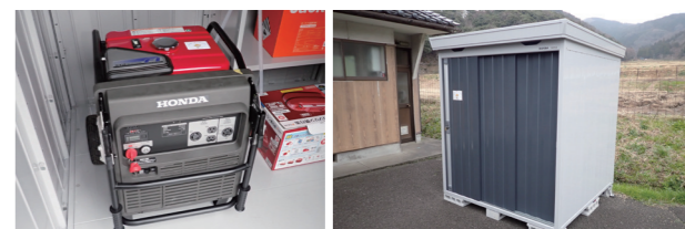
↑防災用資機材((左から)発電機、倉庫)