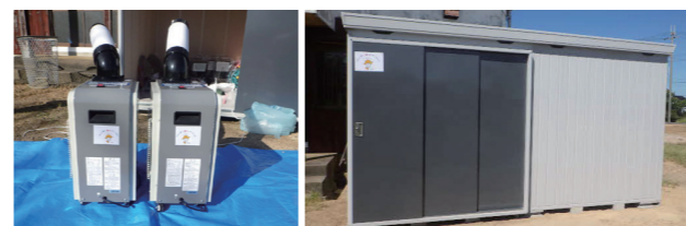
↑防災用資機材((左から)スポットクーラー、倉庫)