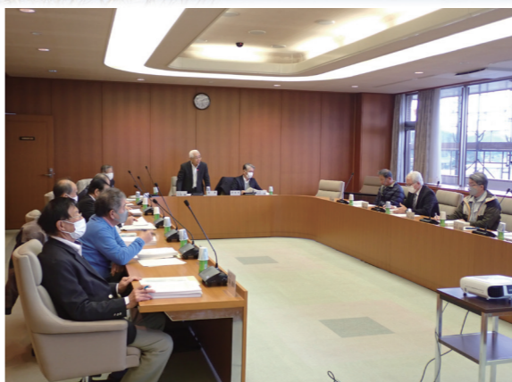
↑ 第218回美浜町原子力環境安全監視委員会

今回の委員会では、発電所の周辺環境への影響等に関する福井県原子力環境安全管理協議会の報告内容を説明しました。また、原子力・核燃料サイクル政策について、経済産業省資源エネルギー庁に説明を求めるとともに、使用済燃料対策ロードマップの概要等について関西電力(株)に説明を求め、使用済燃料の処分等に係る課題を確認しました。委員会での主な質疑は次のとおりです。