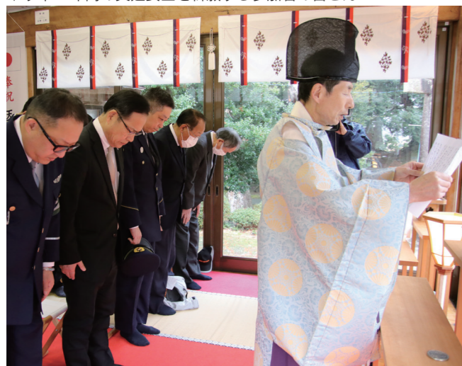
↓今年1年間の交通安全を祈願する参加者の皆さん