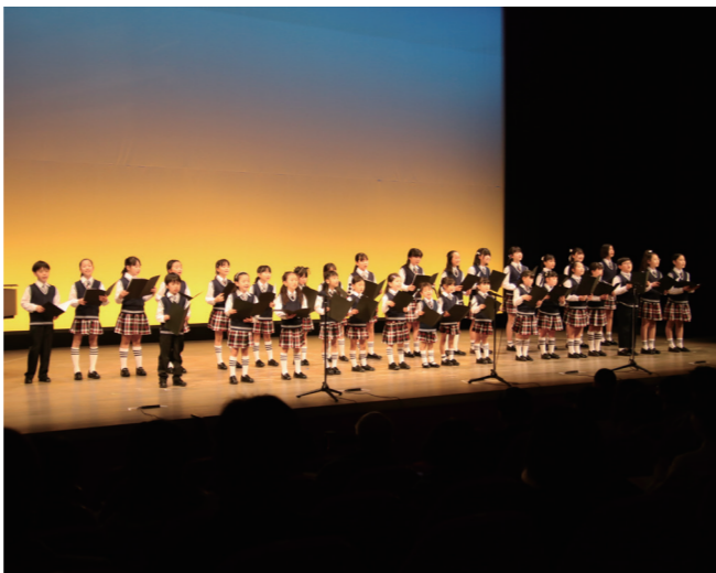
↓練習の成果を披露するなびあす子ども合唱団

1月21日に、水中綱引きが日向湖と若狭湾を結ぶ運河で行われました。 午後2時頃、白いパンツと鉢巻き姿で現れた男衆11人は、橋の欄干から大綱が張られた運河へ威勢よく飛び込みました。東西両岸に分かれた男衆は「ヨイショ、ヨイショ」と大きな掛け声をかけ、10分程で綱を引きちぎり、観客からは大きな歓声が上がっていました。