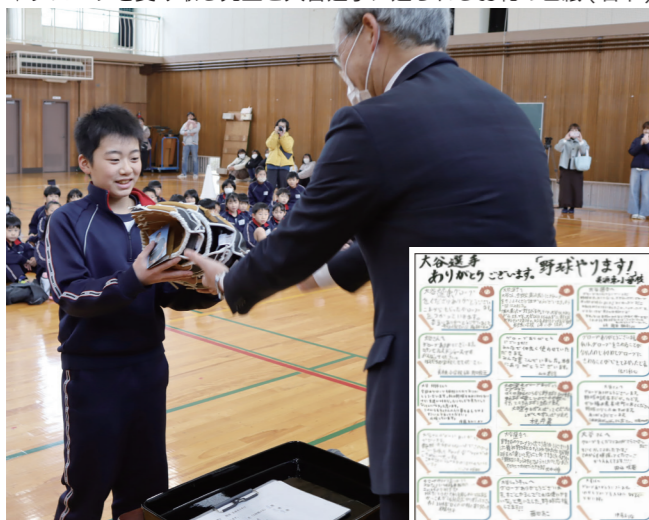
↓グローブを受け取る児童と大谷選手に送られるお礼の色紙(右下)