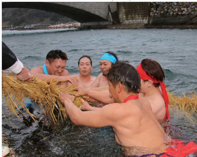
↓大きな掛け声をかけ、綱を引く男衆（西岸）