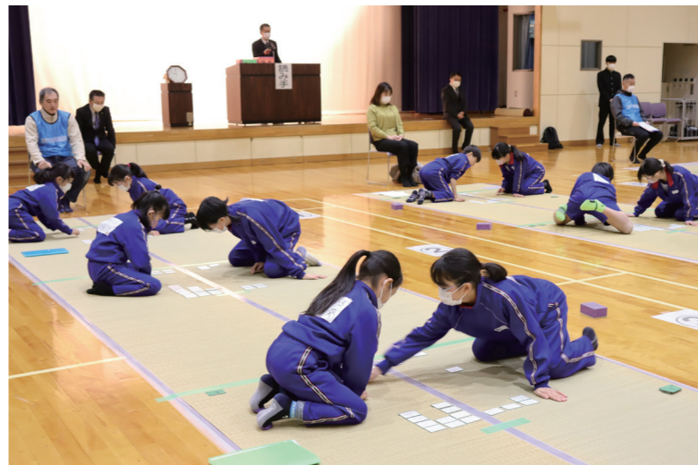
↓上の句が読まれた瞬間に取り札を取り合う児童たち

1月28日に、なびあす子ども合唱団の3周年記念コンサートがなびあすで開催されました。 同合唱団は、子どもたちに歌う楽しさを知ってもらうこと等を目的に町が立ち上げたものです。 コンサートでは、童謡メドレーや嶺南合唱団とのコラボステージを披露し、きれいな歌声がホールを包み込んでいました。