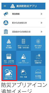
防災アプリアイコン追加イメージ