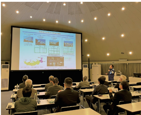
↑美浜原子力PRセンターで説明を受ける参加者

広域避難先の大野市の住民が 美浜発電所等を見学 町では、万が一の原子力災害発生に備えて広域避難計画を策定し、地区ごとの避難先施設や避難方法を定めています。 この避難先施設については、災害発生時の状況（放射性物質放出時の風向きや道路状況等）により決定されますが、町では「大野市」と「おおい町」を避難先と指定し、有事の際に備えています。 10月24日と25日に行われた原子力総合防災訓練では、広域避難計画の避難手順等の確認を行うとともに、おおい町への避難を実施しました。 また、11月14日には、もう一つの避難先である大野市の住民を対象に、原子力災害時の広域避難や原子力発電所について理解を深めることを目的とした見学会を実施しました。