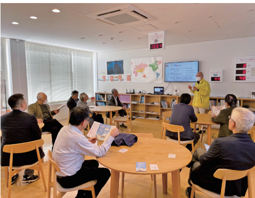
↑きいばすでの見学の様子

見学会に参加された方からは、 ・原子力発電所や広域避難計画等の説明を受け、再確認することができた ・電力の重要性を改めて考える良い機会になった ・広域避難において、大野市側での受け入れ体制等の周知や訓練をしていかなければいけない 等の感想がありました。 町では、今後も、万が一の原子力災害時に広域避難が必要となった場合に備え、住民避難が円滑に実施できるよう、原子力防災等に関する理解促進を図っていきます。