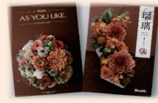
ポイントに応じて交換できる活動奨励品