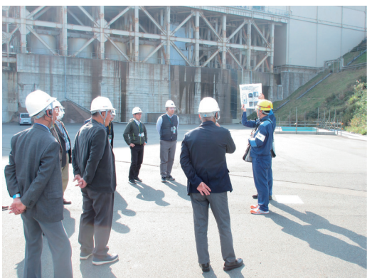
↑美浜発電所を見学する参加者

その後、エネルギー環境教育体験館「きいばす」で町のエネルギー環境教育の取り組みや日常生活におけるエネルギー利用について学びました。