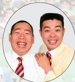
お笑いコンビ レギュラー