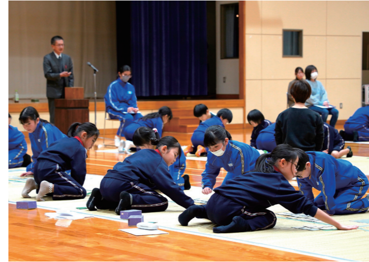
↓上の句が読まれた瞬間に取り札を取り合う児童たち

1月10日から2月28日にかけて、三方五湖ネイチャークルーズで野鳥観察クルーズが開催されました。 このクルーズは、騒音の少ない静かな遊覧船に乗船し、湖面を進みながら冬の三方五湖に集まる多種多様な野鳥を観察してもらうことを目的に行われたものです。 参加者は、日本野鳥の会の会員から解説を聞きながら、オオバンやホシハジロ等の野鳥観察を楽しんでいました。