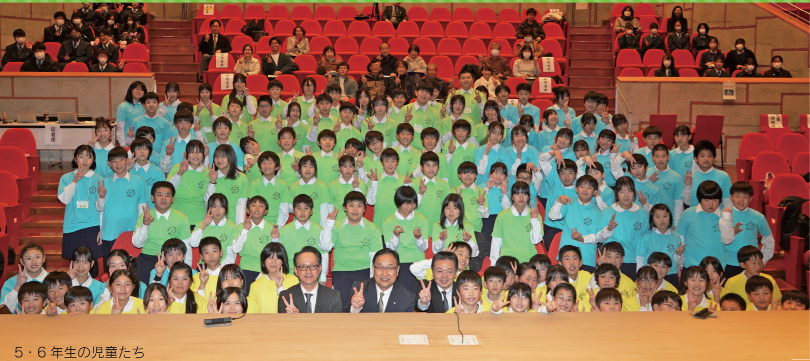
5・6年生の児童たち