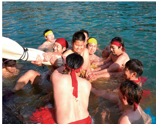
↓極寒の水中で大綱を引きちぎる男衆