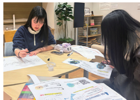
↑動画制作に向けて撮影の準備をする様子

高校生が空き家問題にどう関われるかを考えることが、悩んだ点でした。伝えることも一つの関わり方だと気づき、空き家を活用し、どうすれば興味を持ってもらえるのか試行錯誤し、動画を制作しました。活動を重ねる中で、空き家は活用するだけでなく、持ち主の思いに寄り添うことが大切と感じました。私たちの発信が、誰かの一歩につながれば嬉しいです。