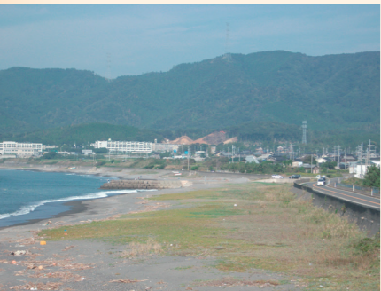
↑金ヶ崎の退き口の際、朝倉勢に襲われた秀吉隊を徳川勢が救ったという佐田の海岸付近

因みに、「金ヶ崎の退き口」は、『太閤記』では秀吉の活躍として、『東遷基業』では東照神君(徳川家康)の功績として、一方の朝倉方でも勝戦戦として記録される等、立場、見方によって「金ヶ崎の退き口」の評価や解釈は大きく変わります。