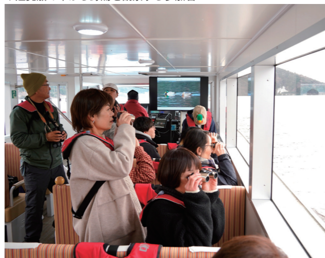
↓遊覧船の中から野鳥を観察する参加者

1月25日に、町民バスケットボール大会が総合体育館で行われました。 大会には、7チーム約80人が参加し、6分4クォーターのトーナメント戦が行われました。参加チームは、素早いパス回しやドリブルを駆使してゴールを奪い合っていました。大会結果は次のとおりです。 優勝 河原市 準優勝 久々子 3位 佐田、早瀬