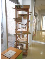
ビコピコカプセル迷路