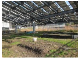
きいばす農園 (見学できます。)