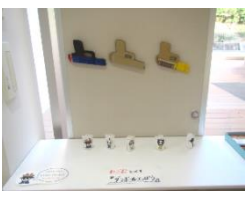
ゴムでっぼうとの当て