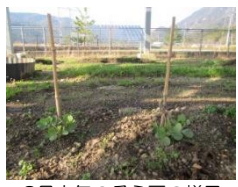
3月中旬のそら豆の様子