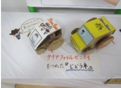
クリアファイルゼンマイ車

館内に、子どもたちが楽しく遊びながら学べる新コーナーが続々とオープンしました。ゴムなど身近なものが持つエネルギーを利用した、ユニークな「段ボールおもちゃ」の展示をはじめ、手軽に挑戦できる「かんたん工作」や「ぬりえ」、そして大人もついつい熱中してしまふ「皿回し」など、バラエティ豊かなラインナップです。この春休み中も、多くの親子連れで賑わいました。