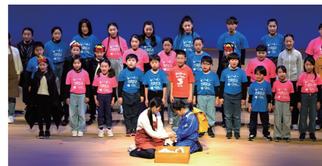
↑演技や歌等を通して命の大切さを伝える子どもたち

3月14日と15日に、なびあす感動体験ミュージカル「いのちのまつり」がなびあすで行われました。 この企画は、なびあすこども合唱団5周年を記念し、ミュージカルを通じた地域の子どもの育成や感動体験による独自の学びの場の提供を目的に、町が企画したものです。 当日子どもたちは、演技や歌等1年間の稽古の成果を披露し、会場は感動で包まれ、涙を流す来場者も見られました。