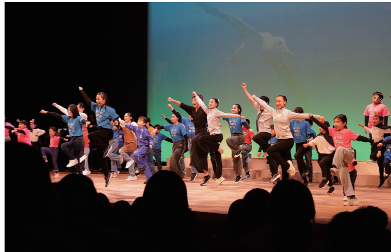
↓ミュージカルのフィナーレでエネルギッシュなダンスを披露する子どもたち

4月4日から5日にかけて、美浜・若狭両町長杯争奪高校野球大会が美浜町民広場野球場で開催されました。 本大会は、今年で56回目の開催となり、嶺南の高校5校が出場し、熱戦が繰り広げられました。 決勝戦では、敦賀気比高校と敦賀工業高校が対戦し、延長タイブレークの11回裏に敦賀気比高校がサヨナラのタイムリーヒットを放ち、24回目の優勝を収めました。