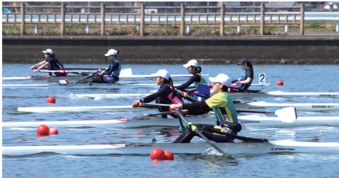
↓力強く艇を漕ぐ選手たち

3月20日と21日に、第21回全国中学校選抜ローイング大会が関電ローイングセンターみはまで行われました。 本大会には、全国から96人の中学生が出場し、シングルスカルでタイムを競い合いました。 大会の結果は次のとおりです。