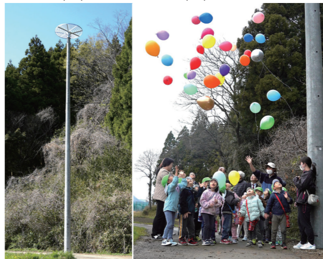
↓人工巣塔の完成を記念して風船を飛ばす、せせらぎ保育園の園児たち(右)と完成した人工巣塔(左)