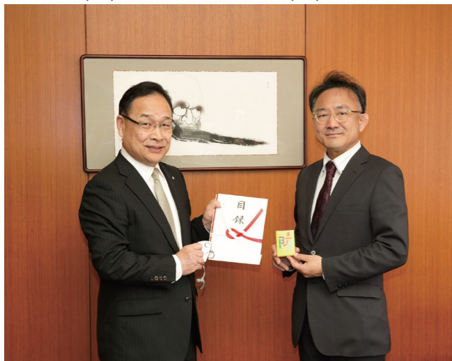
↓戸嶋町長(左)に目録を贈呈する堀社長(右)