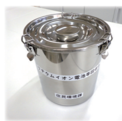
↑リチウムイオン電池等回収缶

● 回収できないもの 回収缶に入らない大きさの電気製品 ※従来通り敦賀市清掃センターへ持込みとなります。(有料)