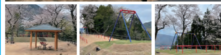
四阿(あずまや) スカイロープ ブランコ 展望デッキ