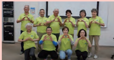
令和7年度フレイルサポーター養成講座に参加した皆さん