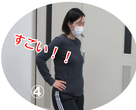
ぶれることなく 1 分以上！