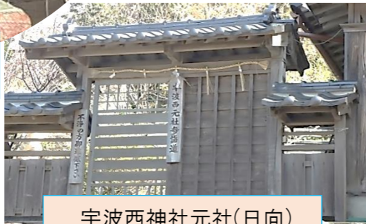
宇波西神社元社(日向)