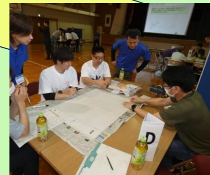
(昨年のHUGを使用しての防災講座の様子)

日時 5月17日(日) 9時30分～11時30分 場所 公民館屋内運動場 定員 40～50名 講師 赤十字防災セミナー指導者 内容 避難所運営ゲーム(HUG) 受付期間 5月8日(金)まで