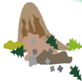
山腹、斜面崩壊箇所の特定