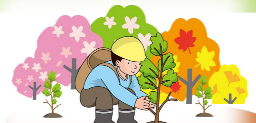
苗木育成、植林体験を通じた森とのふれあい