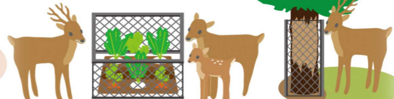
生態系保全、農林業被害削減のためのシカ対策の徹底