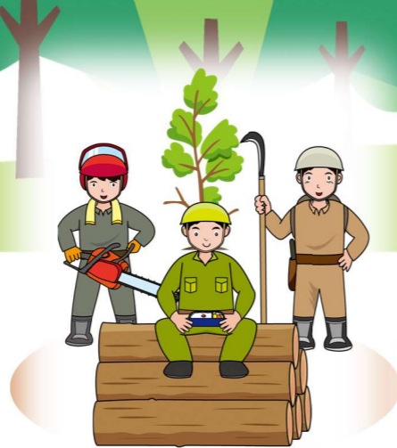
就職や暮らしの面での多様なサポート