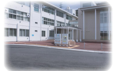
「美浜町エネルギー環境教育体験館さいばす」 電話 0770-39-1116