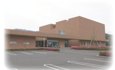
「美浜町生涯学習センターなびあす」 電話 0770-32-1212