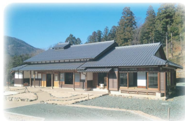
「若狭国吉城歴史資料館」 電話 0770-32-0050