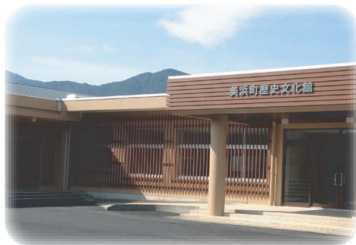
「美浜町歴史文化館」 電話 0770-32-0027

文化遺産カードについては、NPO法人古代瀬波の里・文化遺産ネットワークの文化遺産カード 公式ホームページ herica.net herica.net をご覧ください。