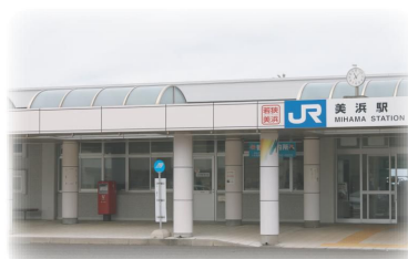
「若狭美浜観光協会」 電話 0770-32-0222