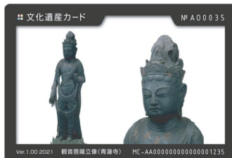
観音菩薩立像(青蓮寺)