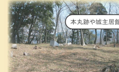
本丸跡や城主居館跡が写っていればOK!