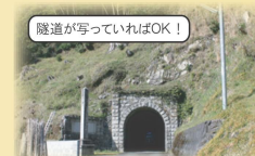
隧道が写っていればOK!