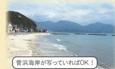
菅浜海岸が写っていればOK!