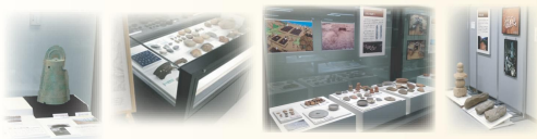
展示された銅鐸や浄土寺遺跡出土品・木簡レプリカ・五輪塔や石仏・洗濯機・須恵器杯が写っていればOK!

22 南伊夜山遺跡出土銅鐸・浄土寺遺跡・弥美郷の木簡・芳春寺山中世墓群・手回し洗濯器・動物の足跡付須恵器