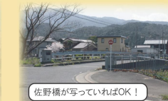
佐野橋が写っていればOK!