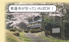
青蓮寺が写っていればOK!