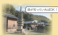
塔が写っていればOK!