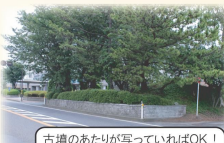
古墳のあたりが写っていればOK!