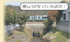
橋りょうが写っていればOK!