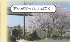
石仏が写っていればOK!