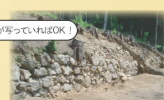
本丸跡や城主居館跡が写っていればOK!