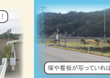
塚や看板が写っていればOK!