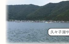
久々子湖や日向湖が写っていればOK!