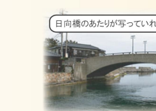
日向橋のあたりが写っていればOK!