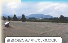
遺跡のあたりが写っていればOK!