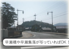
早瀬橋や早瀬集落が写っていればOK!