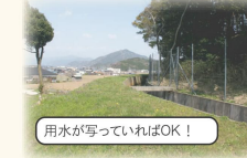
用水が写っていればOK!