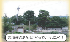
古墳群のあたりが写っていればOK!