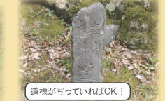
道標が写っていればOK!