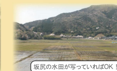
坂戻の水田が写っていればOK!