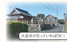
久昌寺が写っていればOK!