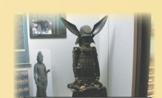
展示室の具足が写っていればOK!