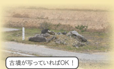
古墳が写っていればOK!