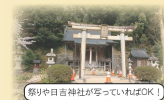
祭りや日吉神社が写っていればOK!