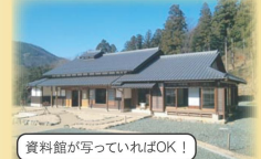
資料館が写っていればOK!