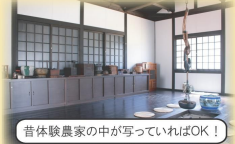
昔体験農家の中が写っていればOK!