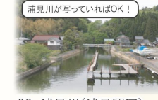
浦見川が写っていればOK!