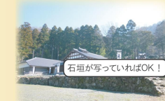
石垣が写っていればOK!