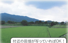
付近の田畑が写っていればOK!

22 南伊夜山遺跡出土銅鐸・浄土寺遺跡・弥美郷の木簡・芳春寺山中世墓群・手回し洗濯器・動物の足跡付須恵器