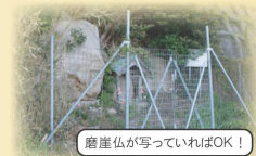
磨崖仏が写っていればOK!

※ 交通ルール、基本的なマナーを守り、見学しましょう。 ※ 史跡、文化財等の見学における各種トラブル・事故等については、美浜町は一切責任を負いません。