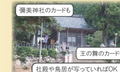
彌美神社のカードも