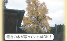
銀杏の木が写っていればOK!